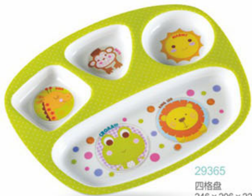
29365 四格盘 246 × 206 × 22mm 6943203406832