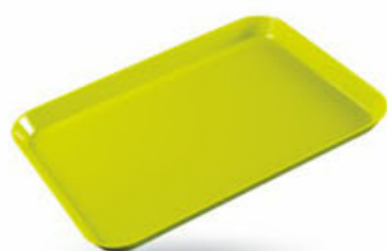
托盘3号 PN330 DIMENSIONS 300L × 215W × 21H mm NUMBER 6943203406788