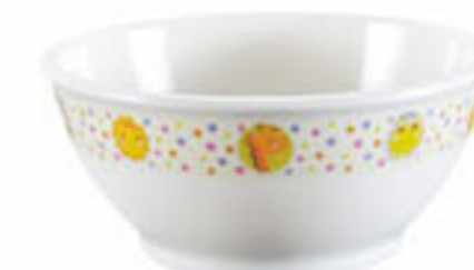
00042 饭碗 104 × 104 × 47mm 6943203406382