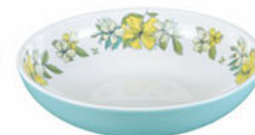
浅蓝 Light Blue