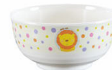
39030 外螺纹碗 154 × 154 × 76mm 6943203406375