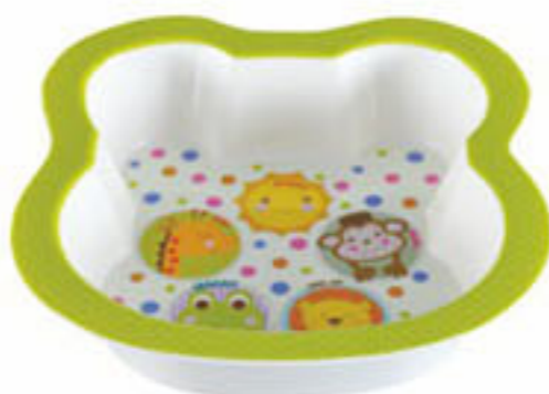
36208 造型盘 145 × 145 × 35mm 6943203406405