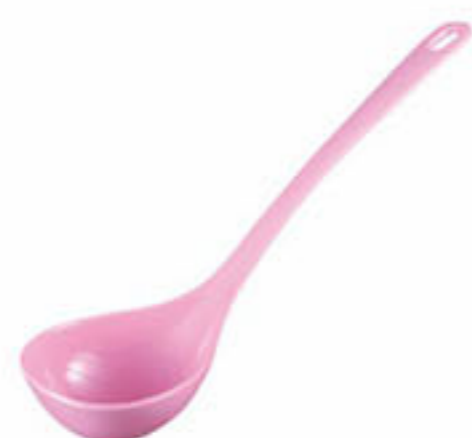
饭勺 98093 DIMENSIONS 320L × 83W × 68H mm NUMBER 6943203404814