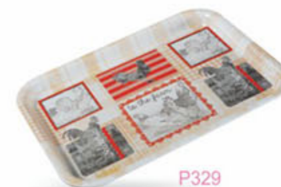
P329 托盘 289 × 192 × 21mm 6943203407402