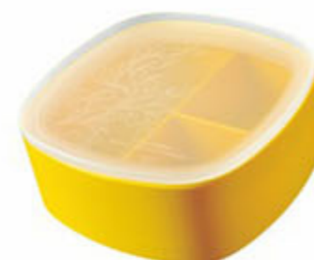
带格保鲜盒 59199 DIMENSIONS 162L × 162W × 60H mm NUMBER 6943203403961