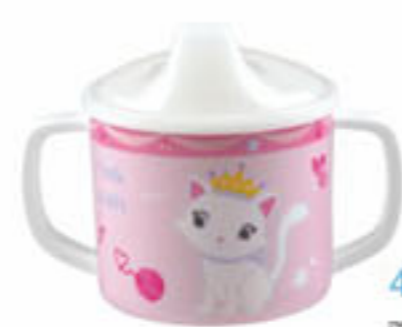
41006 双耳杯 115 × 75 × 66mm 6943203404395