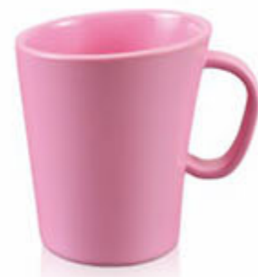
斜角杯 42249 DIMENSIONS 115L × 90W × 105H mm NUMBER 6943203405019