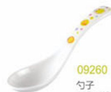
09260 勺子 145 × 40 × 33mm 6943203406542