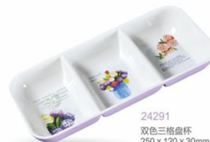
24291 双色三格盘杯 250 × 120 × 30mm 6943203407129