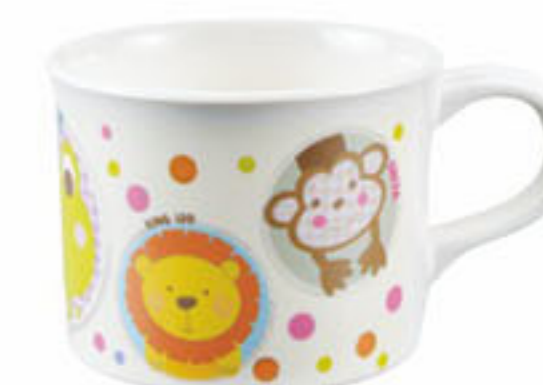
41007 咖啡杯 115 × 85 × 65mm 6943203407242