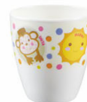
42024 无耳杯 68 × 68 × 74mm 6943203406801