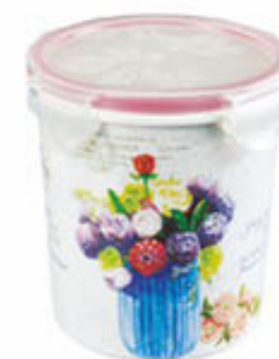
42276 密封罐 117 × 117 × 120mm 6943203405200