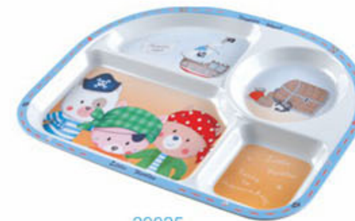
29025 的士盘 269 × 210 × 18mm 6943203405392