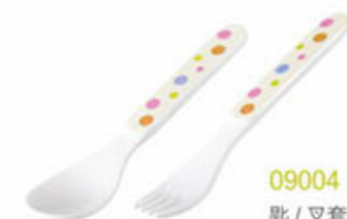
09004 匙 / 叉套装 140 × 35 × 15mm 140 × 23 × 14mm 6943203406603