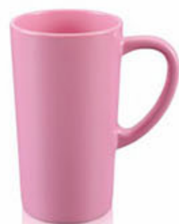
水杯 42017 DIMENSIONS 125L × 81W × 145H mm NUMBER 6943203404067