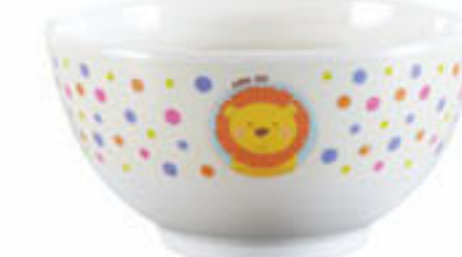
01050 企口碗 126 × 126 × 65mm 6943203407105