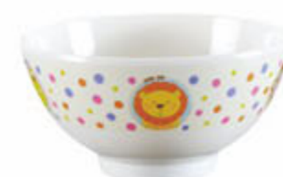
00045 饭碗 113 × 113 × 55mm 6943203405378