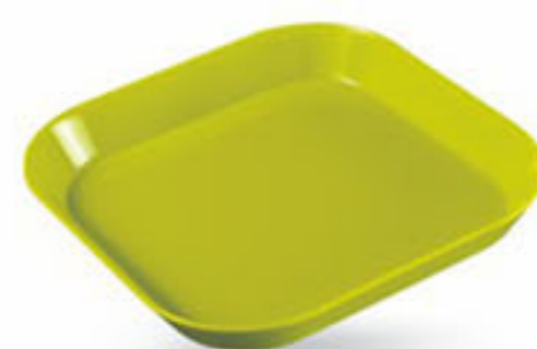
小托盘 52006 DIMENSIONS 148L × 148W × 20H mm NUMBER 6943203404302