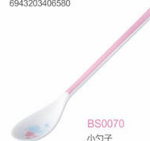
BS0070 小勺子 182 × 29 × 17mm 6943203406894