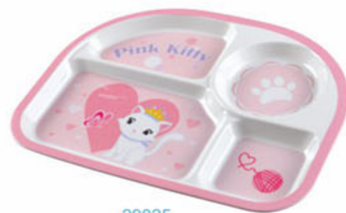
29025 的士盘 269 × 210 × 18mm 6943203405392