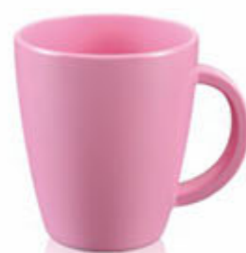
水杯 43052 DIMENSIONS 115L × 88W × 100H mm NUMBER 6943203405033