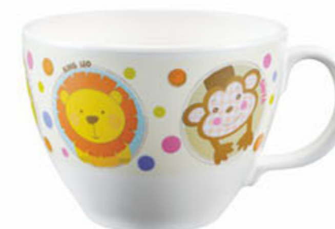
41025 巨无霸杯 152 × 123 × 92mm 6943203406610