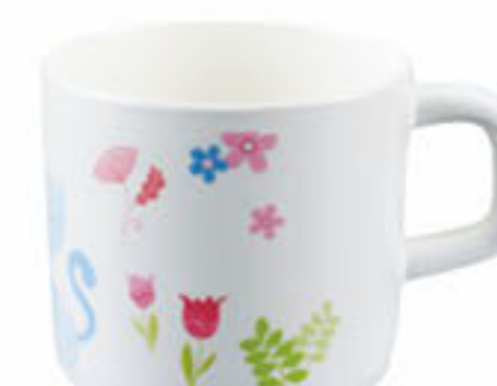
40001 单耳杯 100 × 75 × 67mm 6943203405361