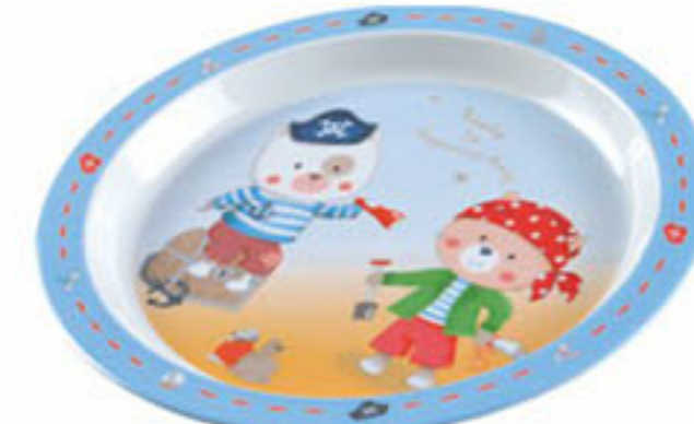
23120 8-1/2"平盘 216 × 216 × 20mm 6943203405972