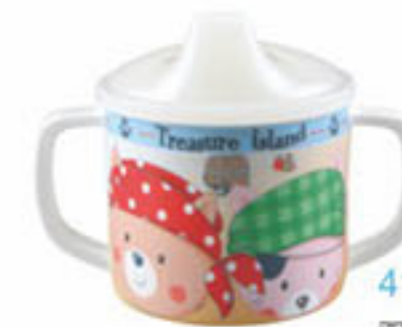
41006 双耳杯 115 × 75 × 66mm 6943203404395