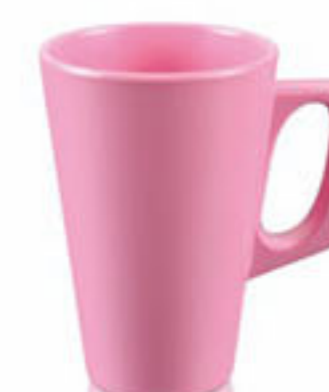
水杯 42246 DIMENSIONS 102L × 75W × 112H mm NUMBER 6943203404982