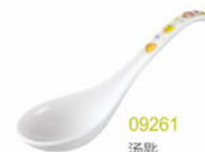
09261 汤匙 168 × 49 × 32mm 6943203406979