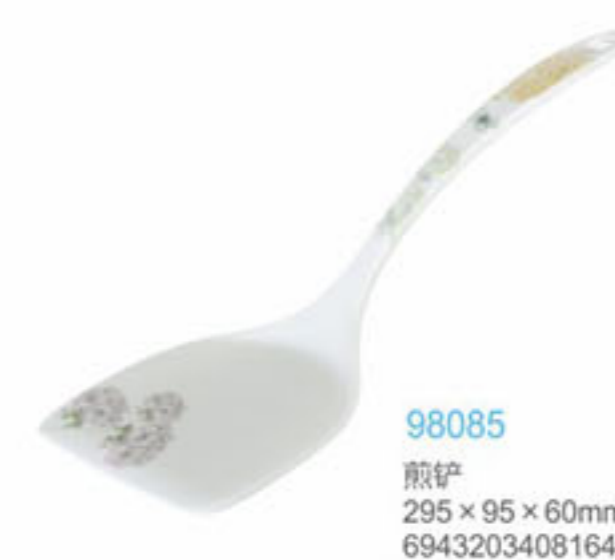
98085 煎铲 295 × 95 × 60mm 6943203408164