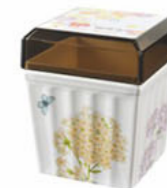
60158 方形棉签盒 79 × 65 × 100mm 6943203407471