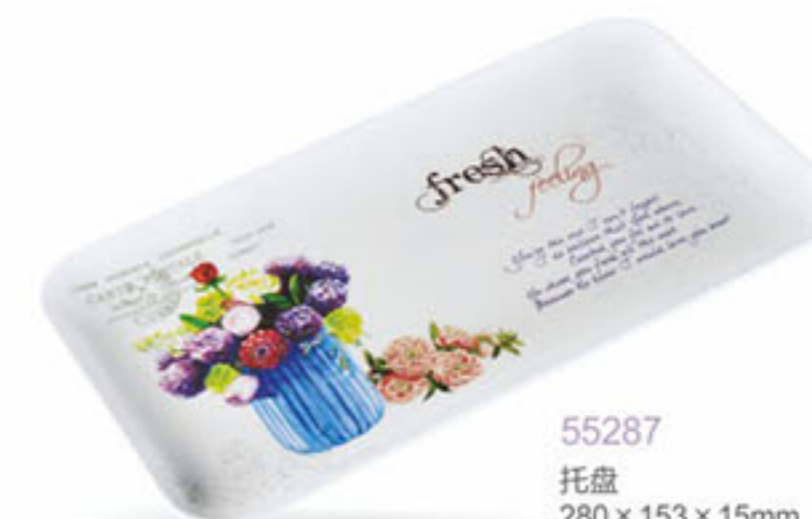
55287 托盘 280 × 153 × 15mm 6943203408058