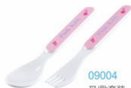
09004 叉/匙套装 140 × 23 × 14mm 140 × 35 × 15mm 6943203406603