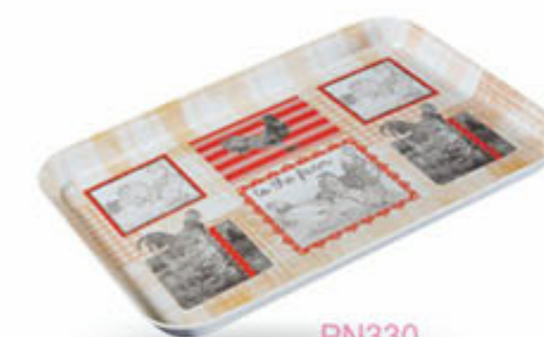
PN330 托盘 300 × 214 × 20mm 6943203406788