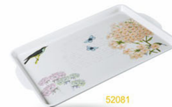
52081 托盘 439 × 305 × 25mm 6943203404890