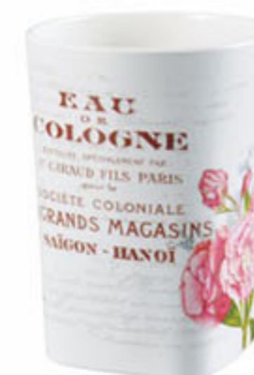
42321 牙刷杯 83 × 83 × 110mm 6943203407600

关于生活的质感， 往往是不动声色的优雅。 它体现在事物的细枝末梢上。 一套优质的餐具不仅使你的 厨房更添色彩， 家人聚餐，宴请宾客， 细节之处都是您生活品质的体现。