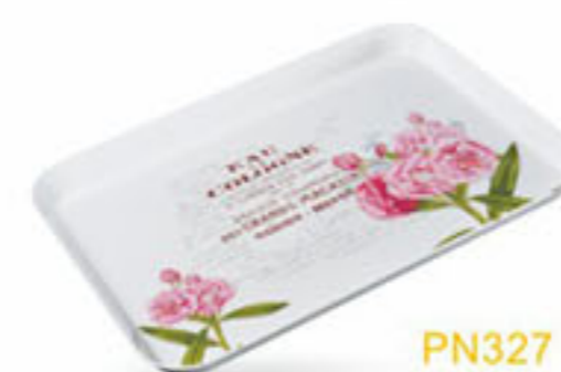
PN327 托盘 269 × 184 × 22mm 6943203404326