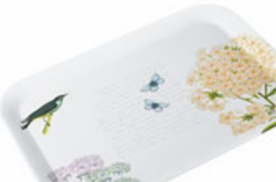
55184 托盘 436 × 323 × 18mm 6943203406757