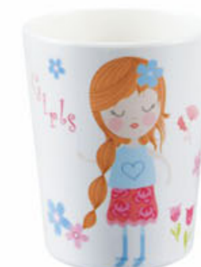
42012 杯子 81 × 81 × 85mm 6943203407198