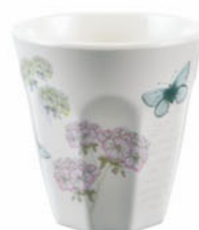
42039 外螺纹碗 90 × 90 × 88mm 6943203406795