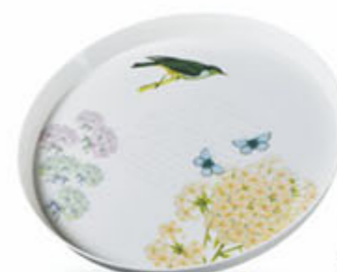
55238 托盘 228 × 228 × 22mm 6943203404258