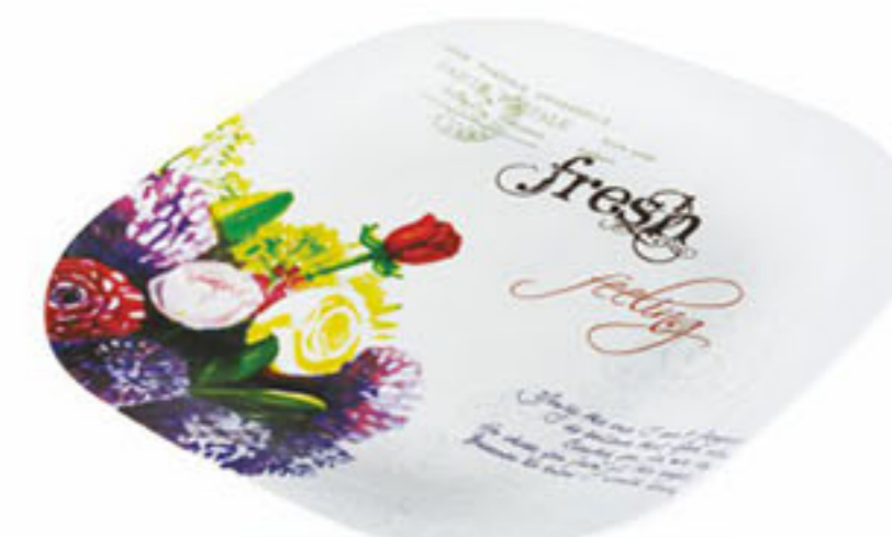
27205 四方碟 265 × 265 × 21mm 6943203408027