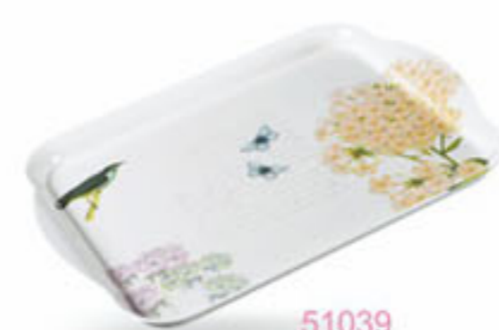
51039 托盘 333 × 244 × 27mm 6943203406672