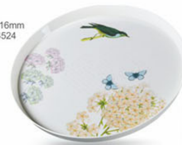
55239 托盘 278 × 278 × 22mm 6943203404265