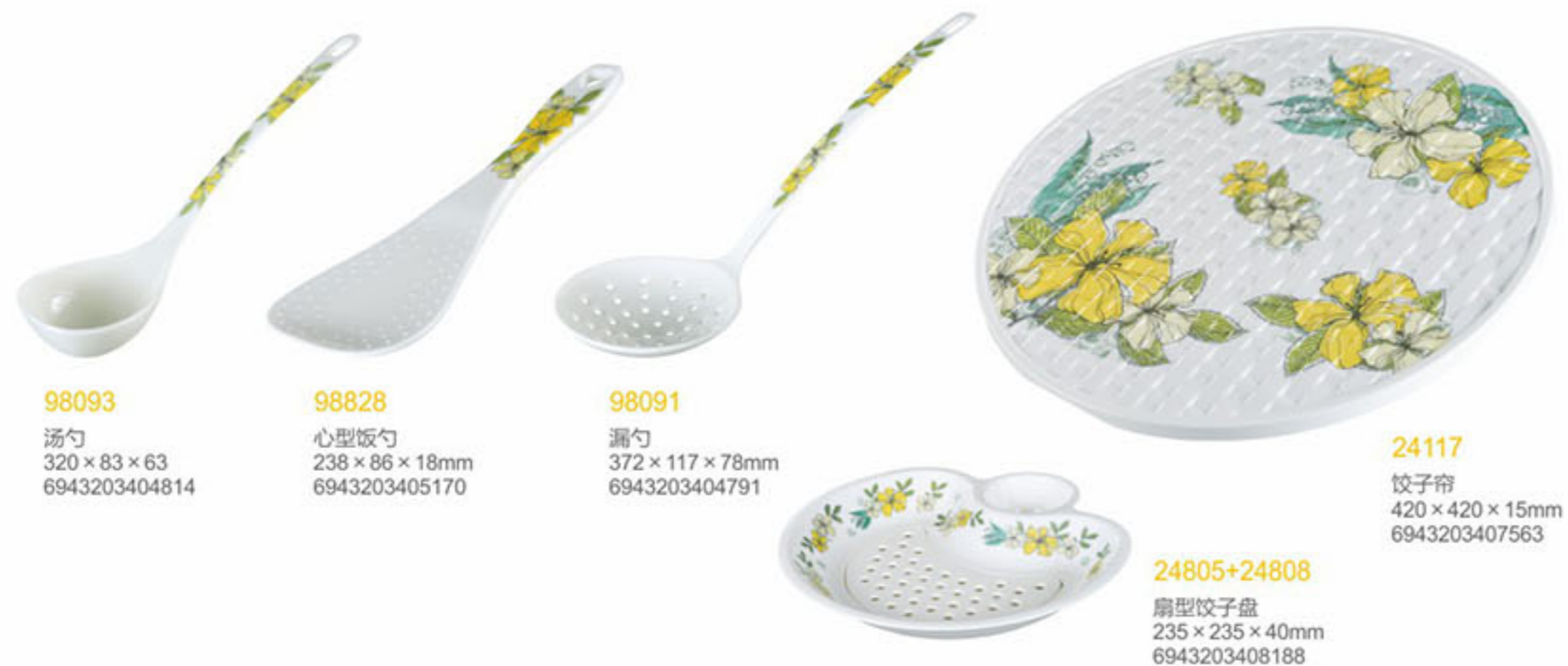
98093 汤勺 320 × 83 × 63 6943203404814