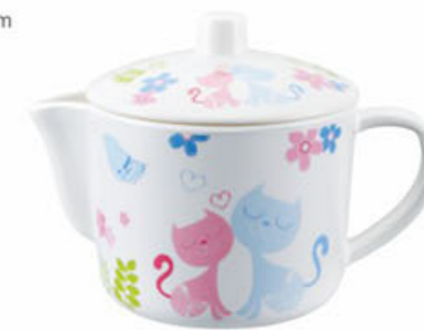
98213+U 小单耳杯 150 × 95 × 75mm 6943203407235