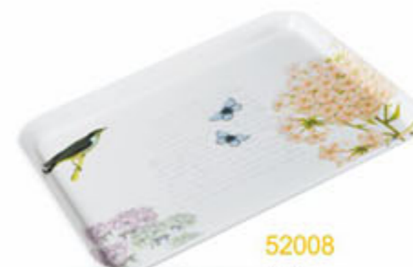
52008 托盘 270 × 213 × 16mm 6943203404524