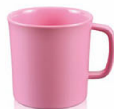
直身杯 42248 DIMENSIONS 110L × 85W × 85H mm NUMBER 6943203405026