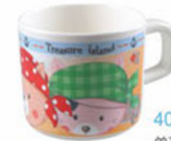
40001 单耳杯 75 × 75 × 67mm 6943203405361