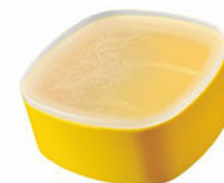
不带格保鲜盒 59198 DIMENSIONS 162L × 162W × 60H mm NUMBER 6943203403978