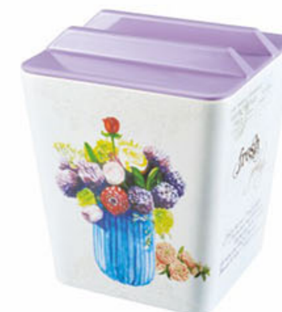
69096+60229U 储物罐 190 × 190 × 204mm 6943203407808