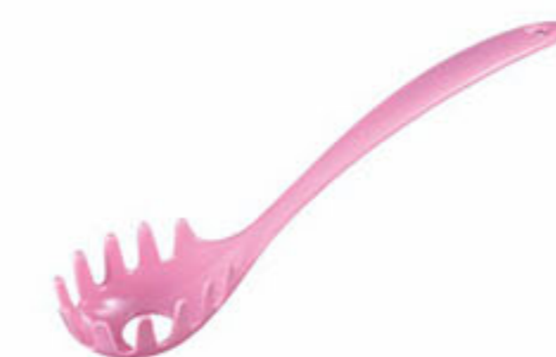
捞面器 98088 DIMENSIONS 275L × 53W × 44H mm NUMBER 6943203404760