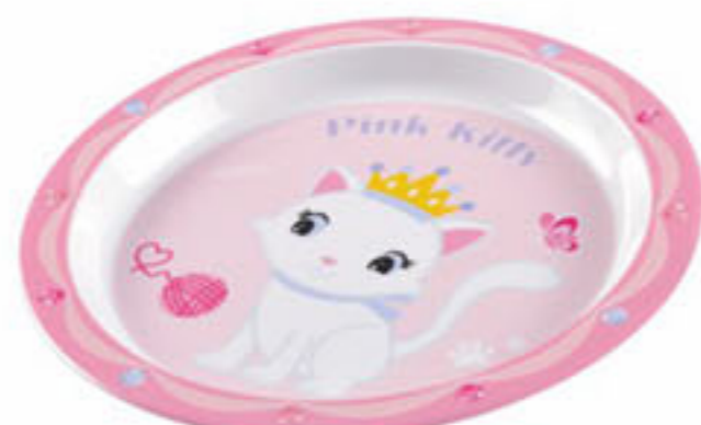
23120 8-1/2"平盘 216 × 216 × 20mm 6943203405972