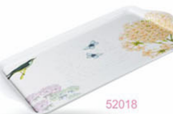
52018 托盘 482 × 295 × 25mm 6943203406740