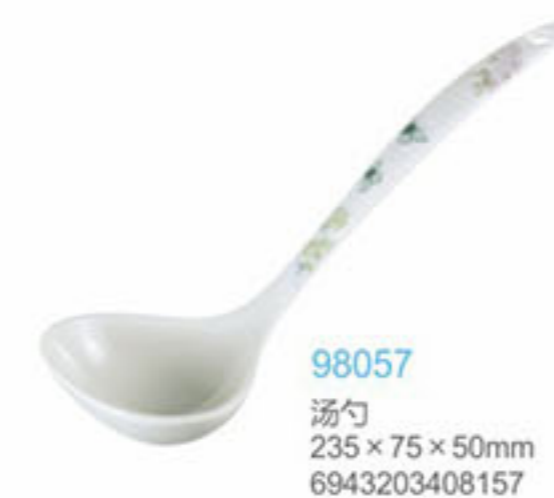
98057 汤勺 235 × 75 × 50mm 6943203408157