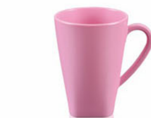
水杯 42079 DIMENSIONS 110L × 82W × 111H mm NUMBER 6943203405064