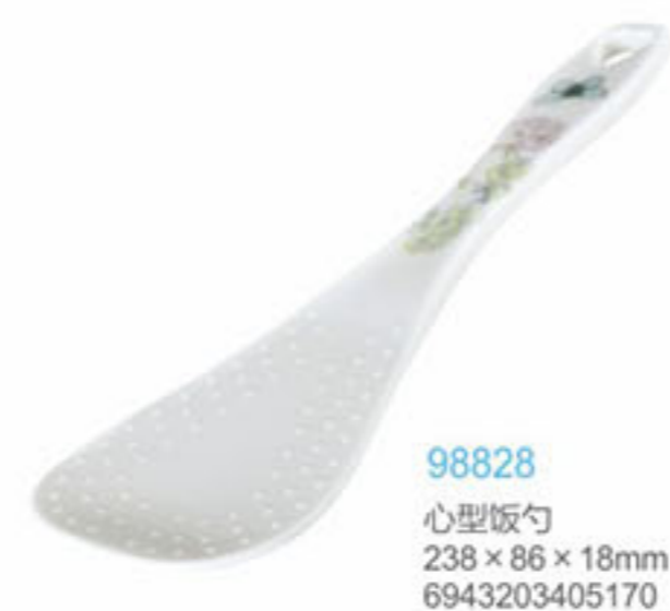
98828 心型饭勺 238 × 86 × 18mm 6943203405170