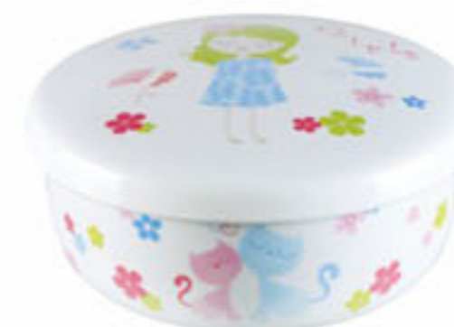
37100+U 带盖小碗 108 × 108 × 50mm 6943203403862