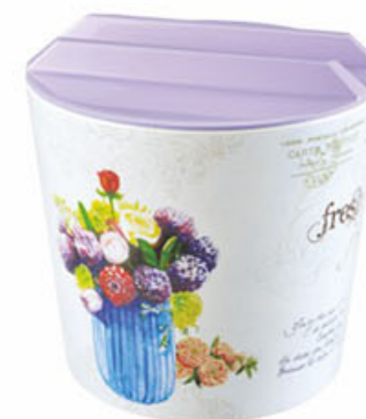
60209+60230U 储物罐 228 × 228 × 200mm 6943203408096