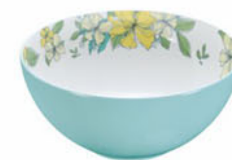
浅蓝 Light Blue