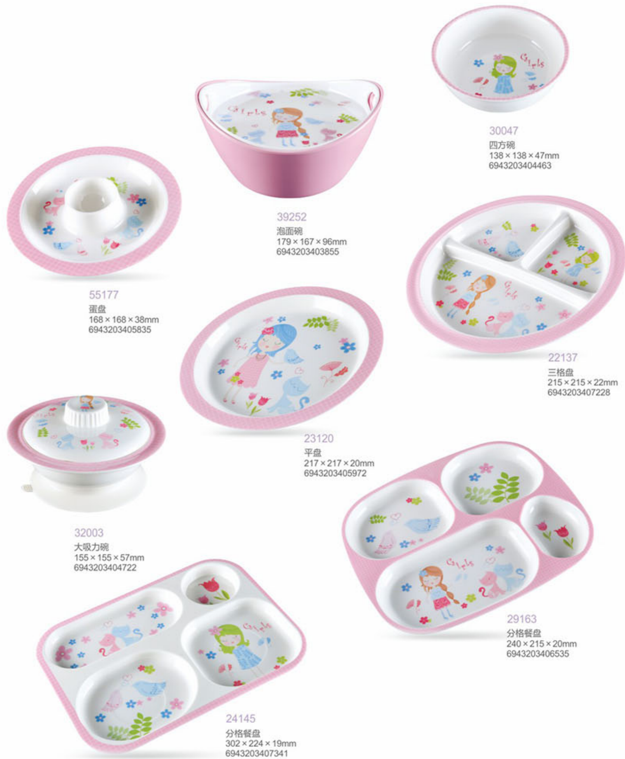
30047 四方碗 138 × 138 × 47mm 6943203404463