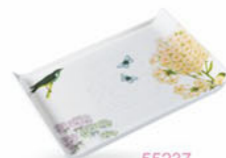
55237 托盘 300 × 160 × 26mm 6943203403473