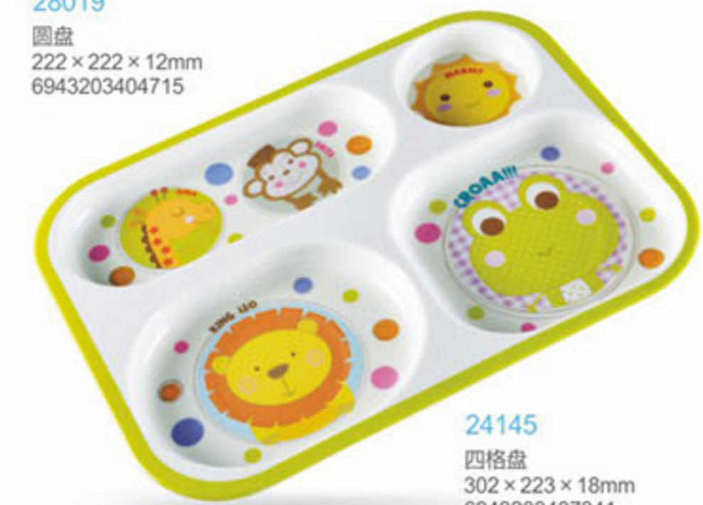
24145 四格盘 302 × 223 × 18mm 6943203407341