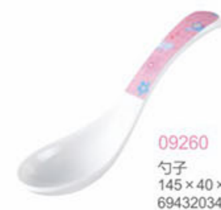
09260 勺子 145 × 40 × 33mm 6943203406542