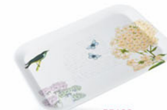
55182 托盘 334 × 259 × 17mm 6943203406771