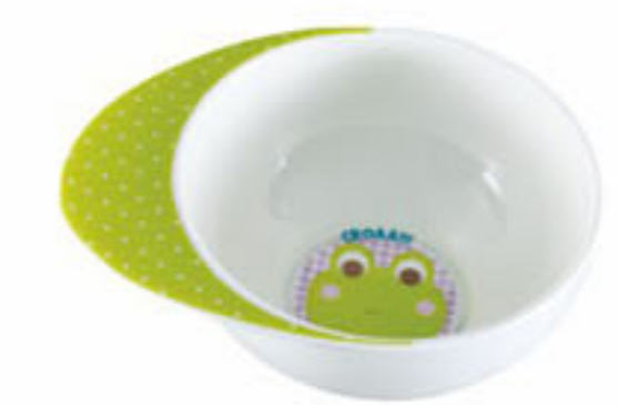
36014 小单耳碗 110 × 90 × 45mm 6943203405354