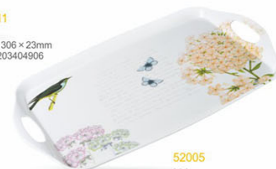
52005 托盘 440 × 285 × 22mm 6943203403923