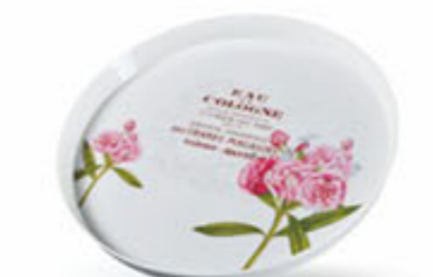
55238 托盘 228 × 228 × 22mm 6943203404258