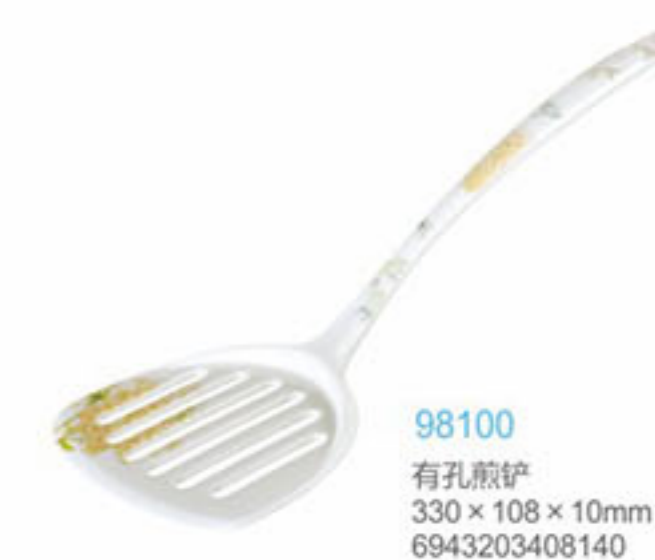
98100 有孔煎铲 330 × 108 × 10mm 6943203408140