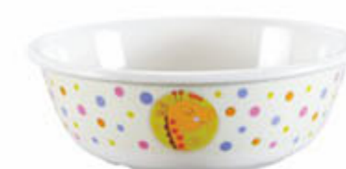
39039 5"儿童饭碗 128 × 128 × 47mm 6943203406344