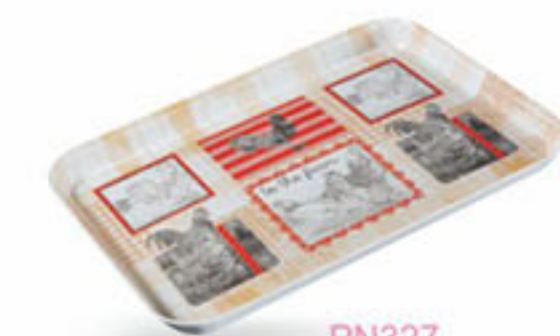
PN327 托盘 269 × 184 × 22mm 6943203404326