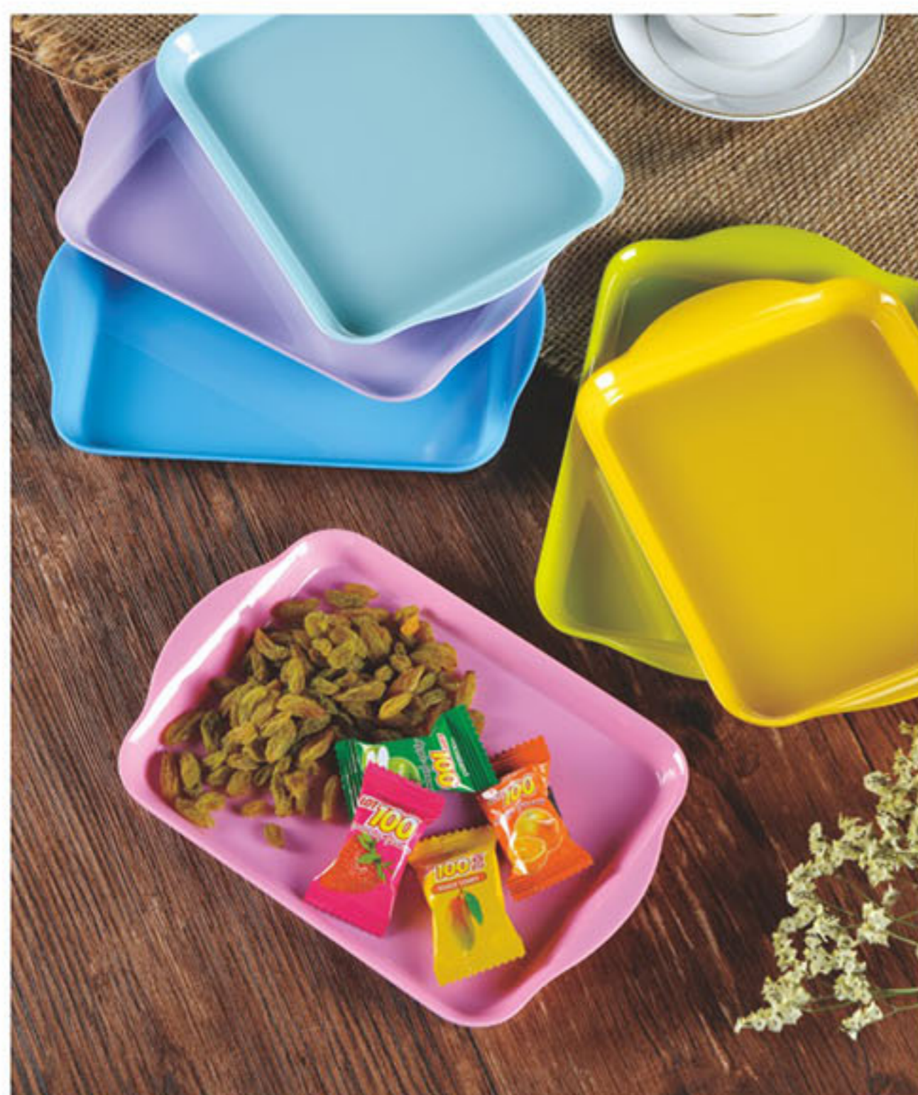
Collection Colors 可选颜色