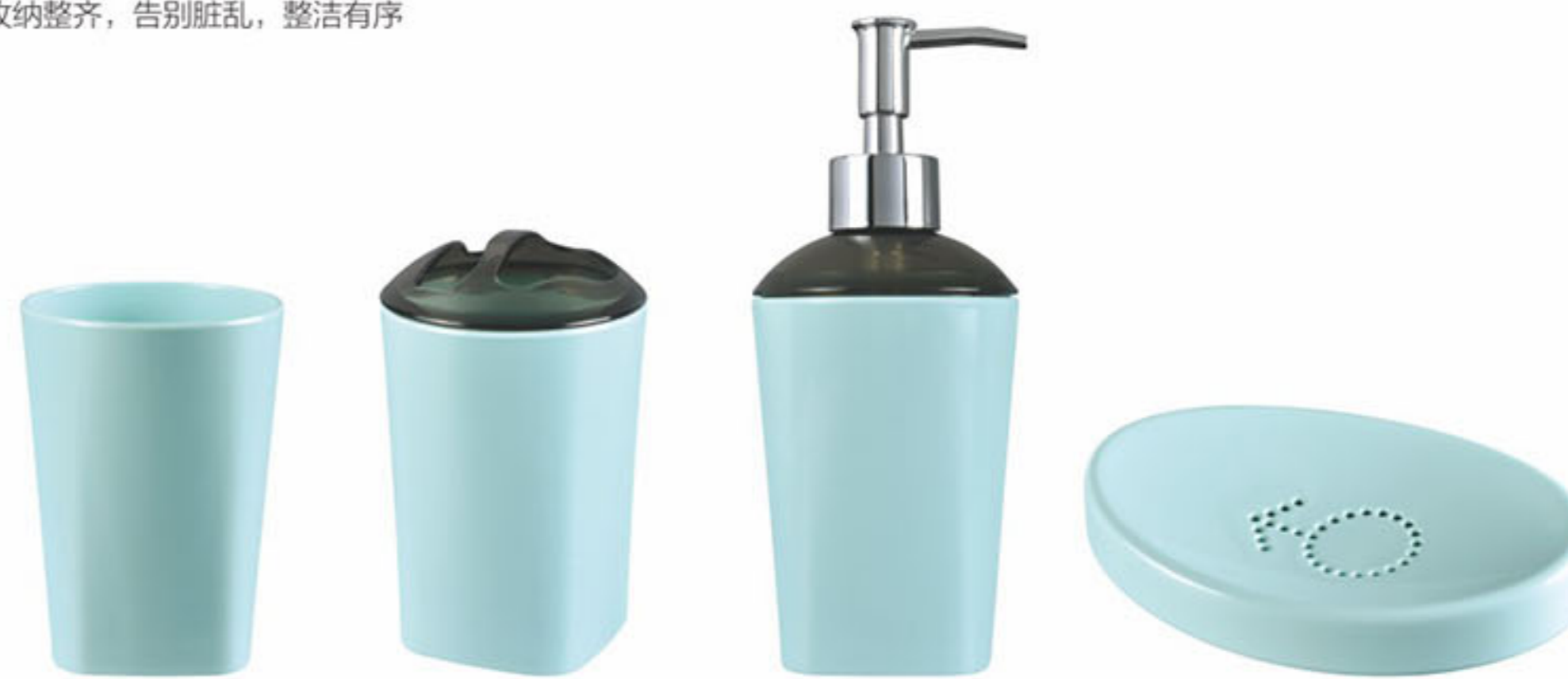
牙刷架/乳液瓶/牙刷杯 × 2 42321

DIMENSIONS 83L × 83W × 110H mm NUMBER 6943203407600