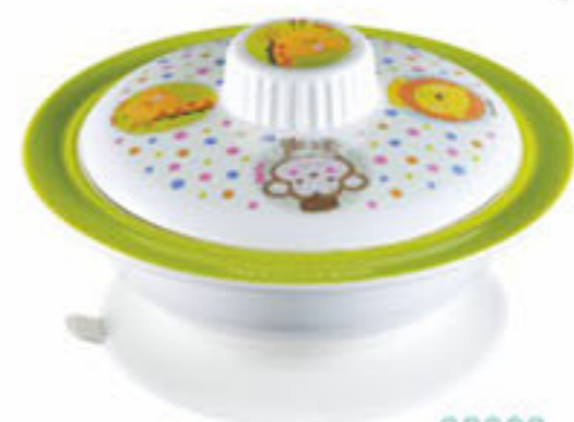
32003 大吸力碗 158 × 158 × 45mm 125 × 125 × 40mm 6943203404722