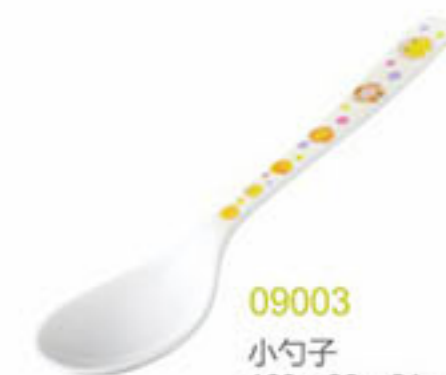
09003 小勺子 169 × 39 × 21mm 6943203406580