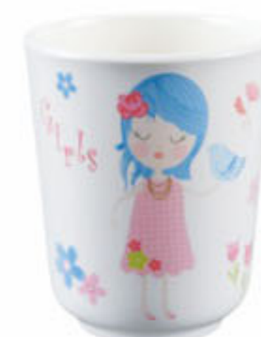
41013 小无耳杯 70 × 70 × 84mm 6943203407181