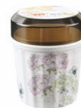
60159 圆形棉签盒 77 × 64 × 100mm 6943203407488