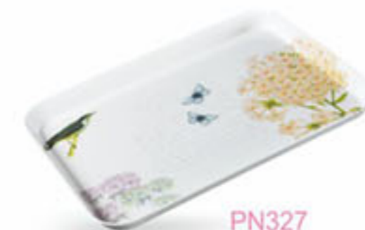
PN327 托盘 269 × 184 × 22mm 6943203404326