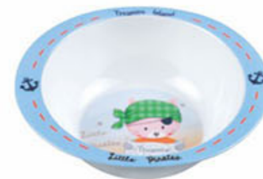
33121 奇哥碗 152 × 138 × 45mm 6943203404753