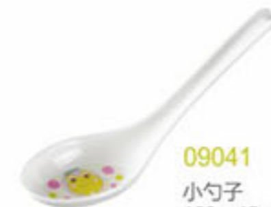
09041 小勺子 160 × 45 × 17mm 6943203406559