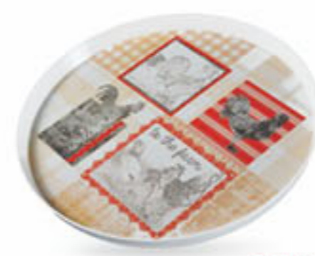
55238 托盘 228 × 228 × 22mm 6943203404258