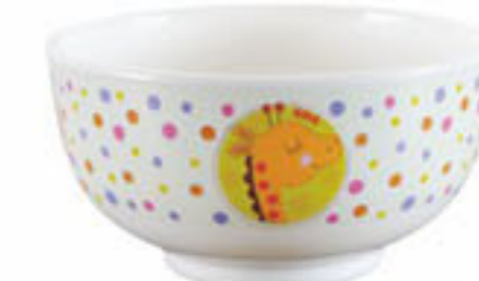
33052 小碗 128 × 128 × 65mm 6943203404432