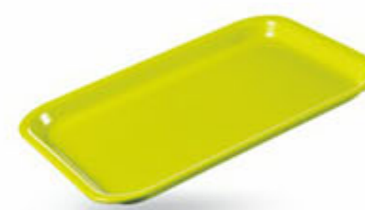
托盘 P329 DIMENSIONS 289L × 192W × 21H mm NUMBER 6943203407402