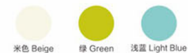
Collection Colors 可选颜色