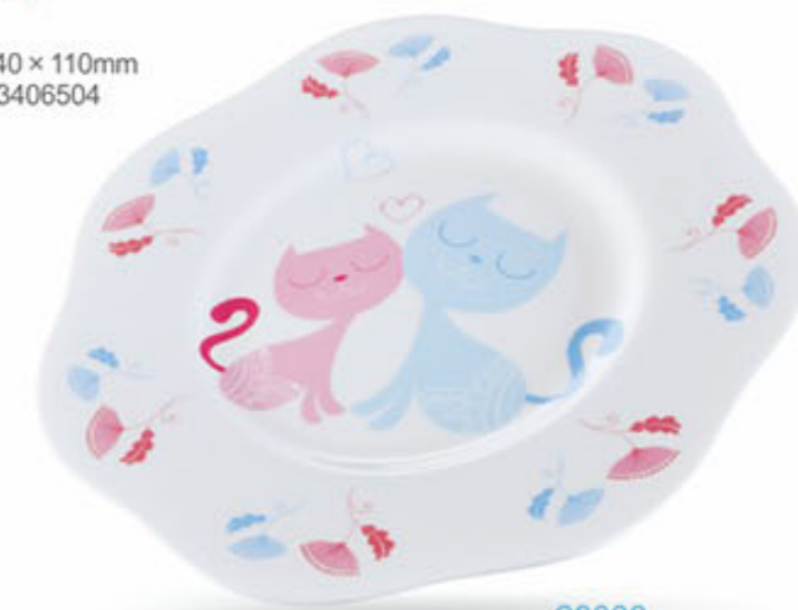
28008 花形盘 210 × 210 × 13mm 6943203407143