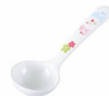
98251 汤匙 145 × 55 × 42mm 6943203407211