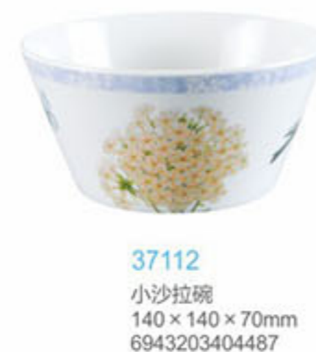
37112 小沙拉碗 140 × 140 × 70mm 6943203404487