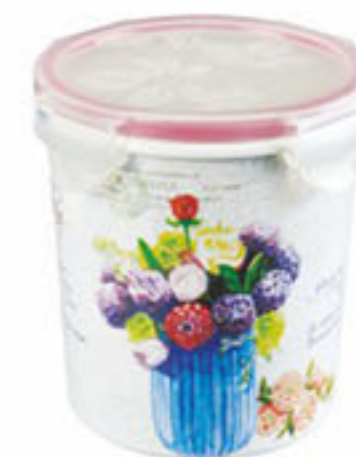
42277 密封罐 122 × 122 × 128mm 6943203405217