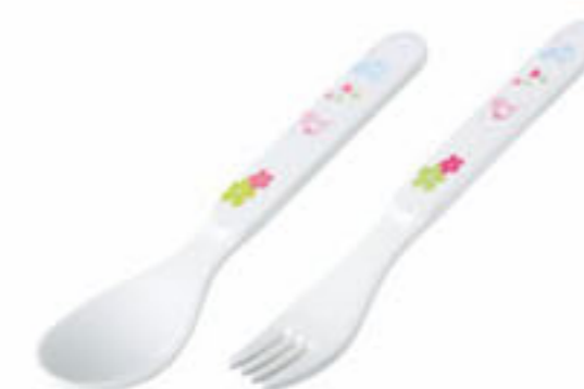
09004 匙 / 叉套装 140 × 35 × 15mm 140 × 23 × 14mm 6943203406603