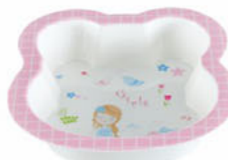
36208 造型盘 145 × 140 × 32mm 6943203406405