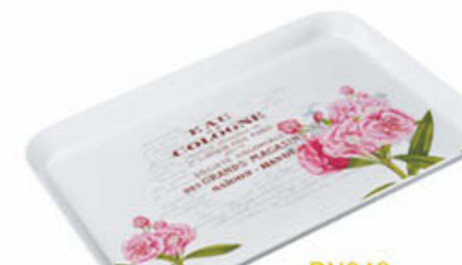
PN342 托盘 420 × 310 × 30mm 6943203407716