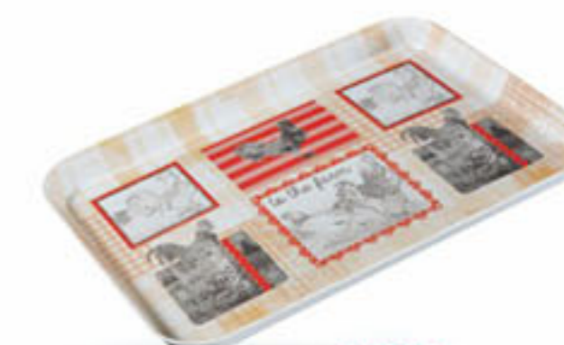
PN335 托盘 350 × 249 × 22mm 6943203404333