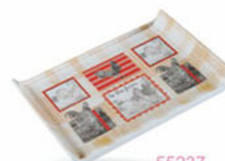
55237 托盘 300 × 160 × 26mm 6943203403473