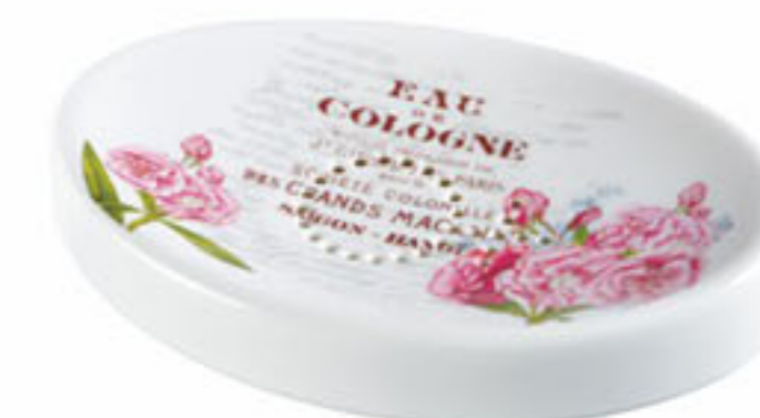
60164D+60162U 香皂盒 155 × 100 × 22mm 6943203407518