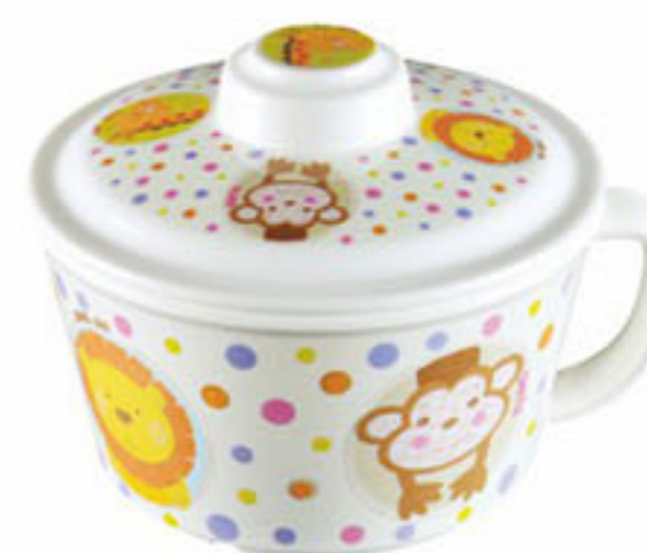
42038+U 单耳杯 160 × 140 × 110mm 6943203406504