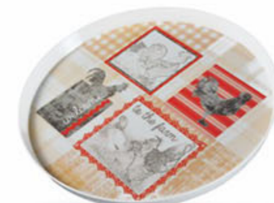
55239 托盘 280 × 280 × 22mm 6943203404265