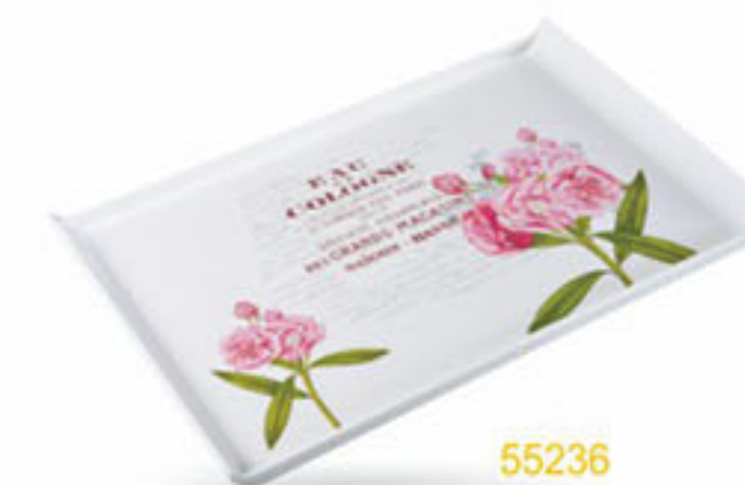
55236 托盘 460 × 290 × 30mm 6943203403534