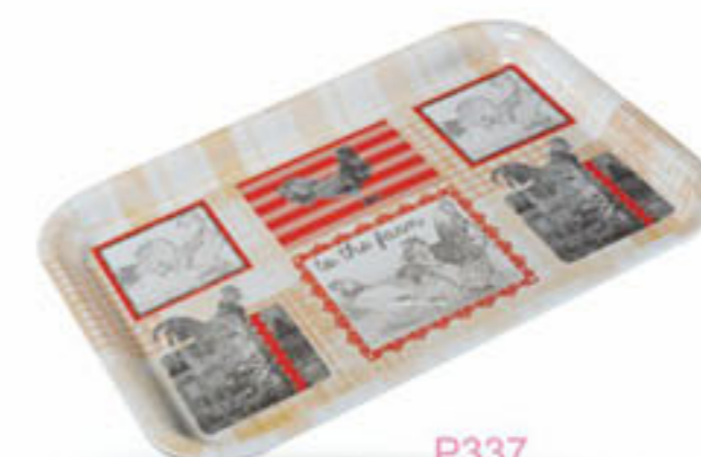
P337 托盘 373 × 279 × 22mm 6943203407426