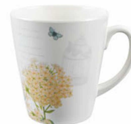
42027 杯子 120 × 95 × 103mm 6943203403817