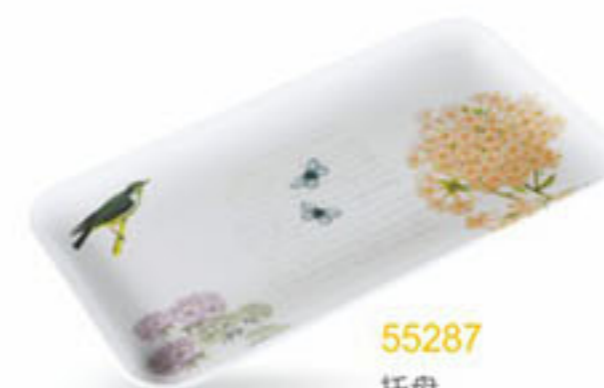
55287 托盘 280 × 153 × 15mm 6943203408058