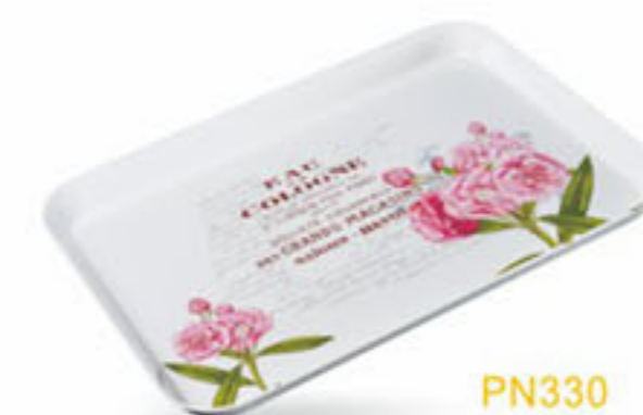
PN330 托盘 300 × 214 × 20mm 6943203406788