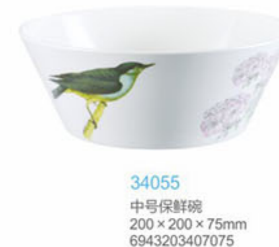
34055 中号保鲜碗 200 × 200 × 75mm 6943203407075