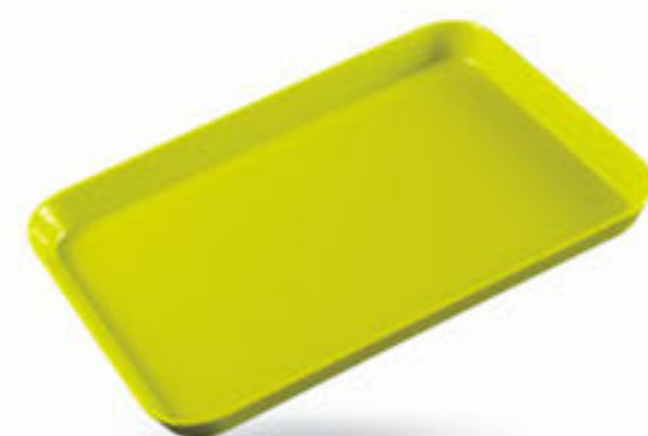
托盘5号 PN338 DIMENSIONS 380L × 280W × 23H mm NUMBER 6943203404340