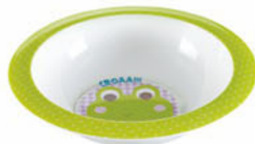
30047 圆碗 138 × 138 × 47mm 6943203404463