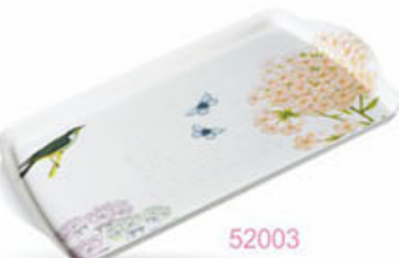
52003 托盘 382 × 239 × 19mm 6943203403916