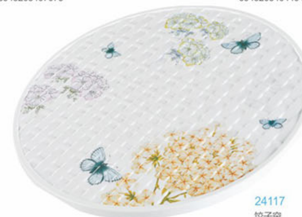
24117 饺子帘 420 × 420 × 15mm 6943203407563