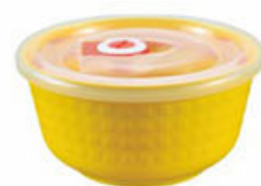
小号密封保鲜盒 39667 DIMENSIONS 106L × 106W × 62H mm NUMBER 6943203405248