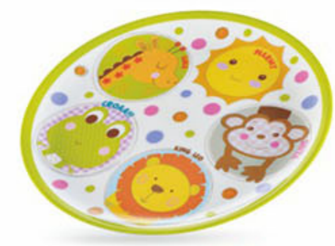
28019 圆盘 222 × 222 × 12mm 6943203404715