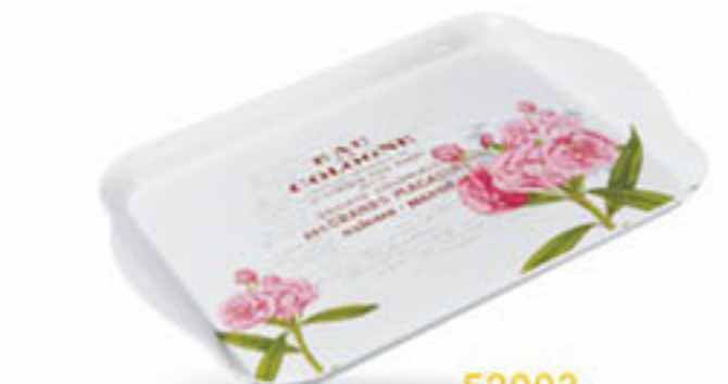
52003 托盘 382 × 239 × 19mm 6943203403916