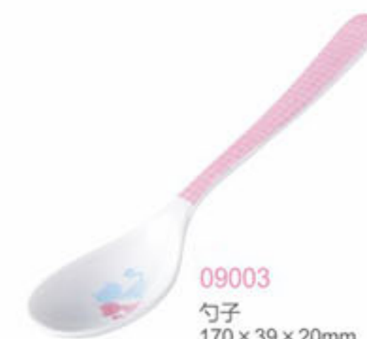
09003 勺子 170 × 39 × 20mm 6943203406580