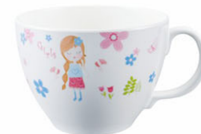
41025 巨无霸杯 152 × 123 × 92mm 6943203406610