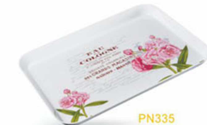
PN335 托盘 350 × 249 × 22mm 6943203404333