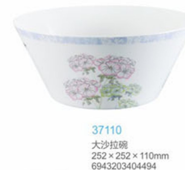
37110 大沙拉碗 252 × 252 × 110mm 6943203404494