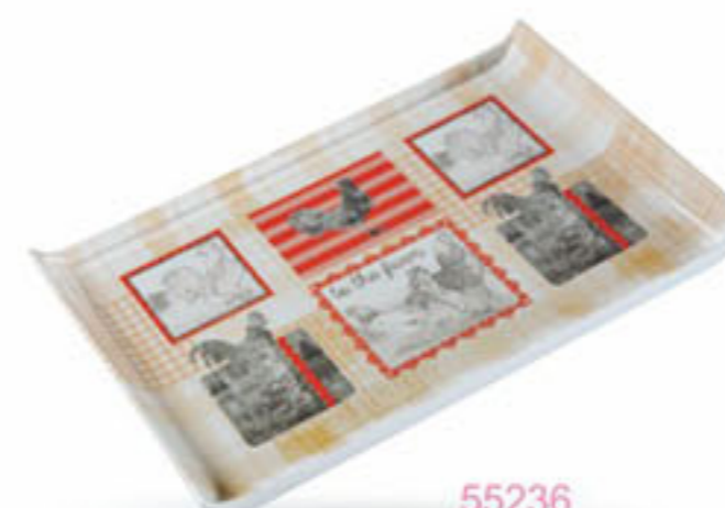
55236 托盘 460 × 289 × 28mm 6943203403534