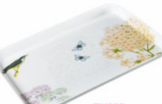
PN338 托盘 380 × 280 × 23mm 6943203404340