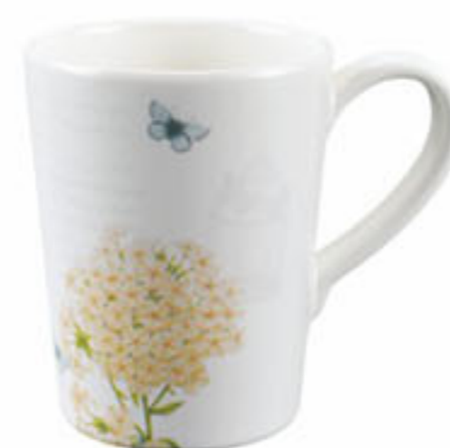
LC3528 带边杯 120 × 80 × 102mm 6943203408201