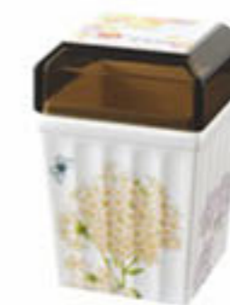
60160 方形牙签盒 56 × 47 × 83mm 6943203407457