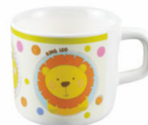
40001 单耳杯 100 × 75 × 67mm 6943203405361