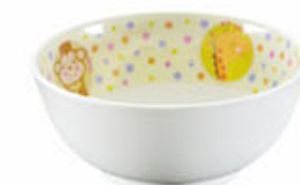
KD504 小碗 116 × 116 × 50mm 6943203406429