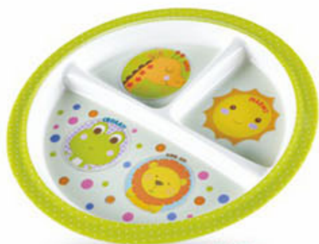
22137 三格盘 215 × 215 × 22mm 6943203407228