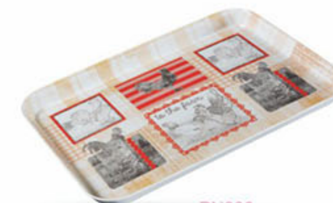
PN338 托盘 380 × 280 × 23mm 6943203404340