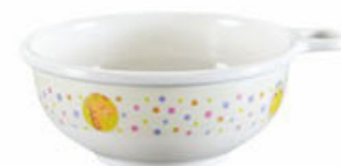
39037 单耳碗 135 × 112 × 45mm 6943203406351