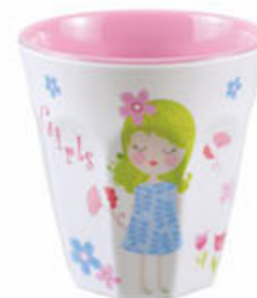
42039 九角杯 90 × 90 × 88mm 6943203406795