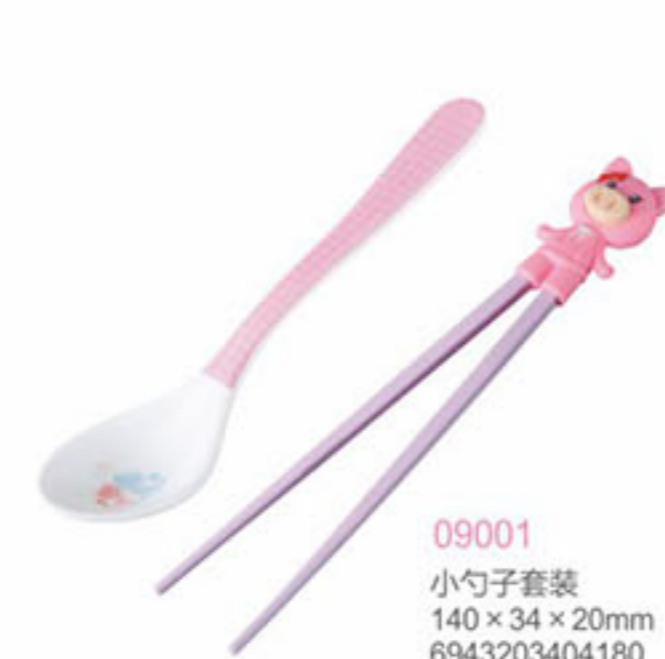
09001 小勺子套装 140 × 34 × 20mm 6943203404180