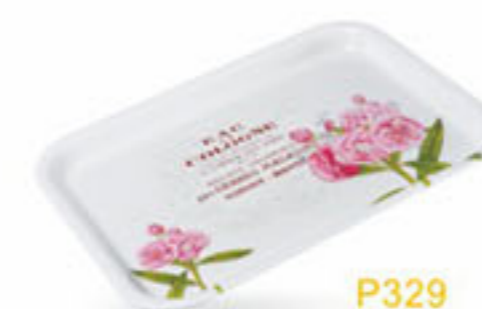
P329 托盘 289 × 192 × 21mm 6943203407402