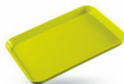
小托盘 PN323 DIMENSIONS 230L × 160W × 20H mm NUMBER 6943203407068