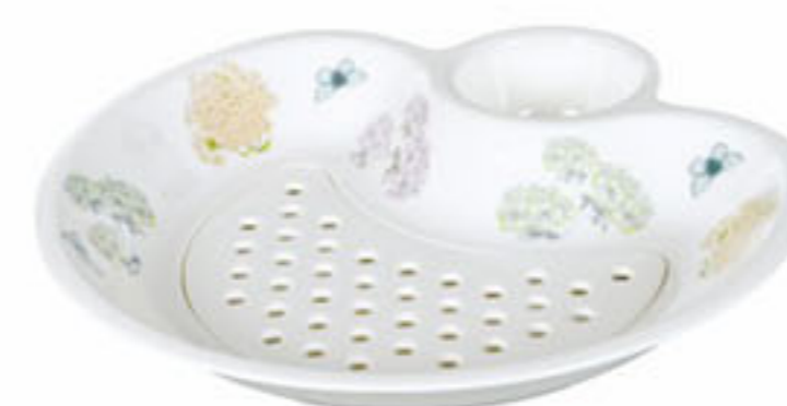
24805+24808 扇型饺子盘 235 × 235 × 40mm 6943203408188