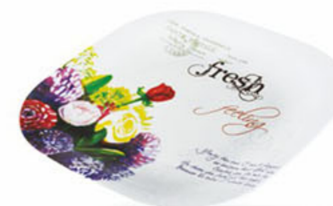
28083 四方碟 216 × 216 × 18mm 6943203408034