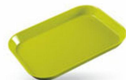
小托盘 29629 DIMENSIONS 210L × 150W × 20H mm NUMBER 6943203403688