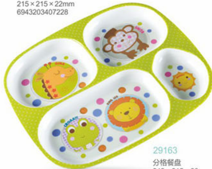
29163 分格餐盘 242 × 215 × 20mm 6943203406535