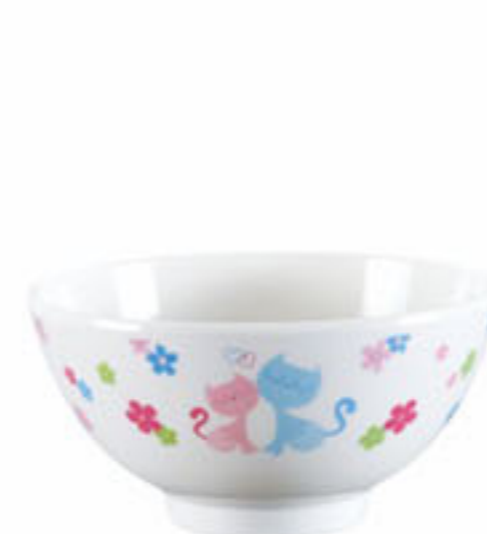
01050 企口碗 126 × 126 × 65mm 6943203407105