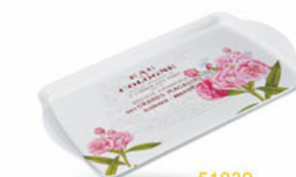
51039 托盘 333 × 244 × 27mm 6943203406672