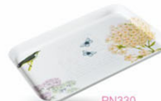
PN330 托盘 300 × 214 × 20mm 6943203406788