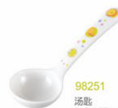
98251 汤匙 148 × 57 × 34mm 6943203407211