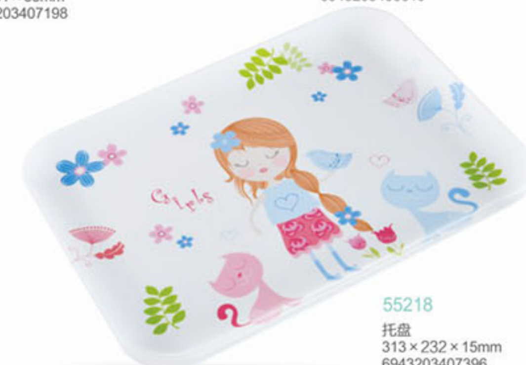
55218 托盘 313 × 232 × 15mm 6943203407396