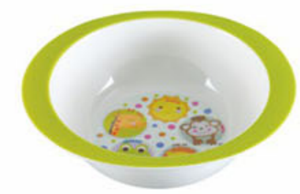
33121 奇哥碗 152 × 138 × 45mm 6943203404753