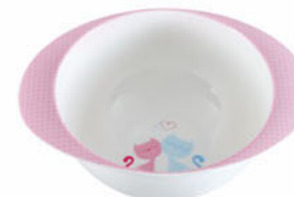
36005 双耳碗 160 × 120 × 60mm 6943203407006