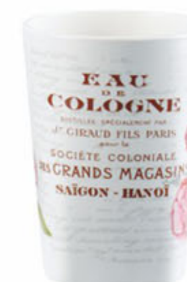
42321 牙刷杯 83 × 83 × 110mm 6943203407600