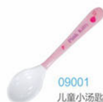
09001 儿童小汤匙 140 × 34 × 20mm 6943203404180