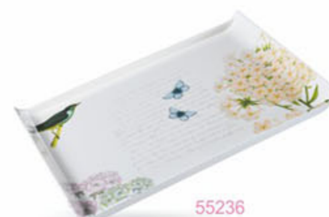
55236 托盘 460 × 289 × 28mm 6943203403534