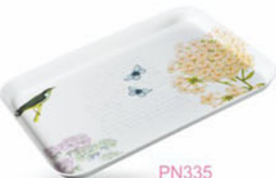
PN335 托盘 350 × 249 × 22mm 6943203404333