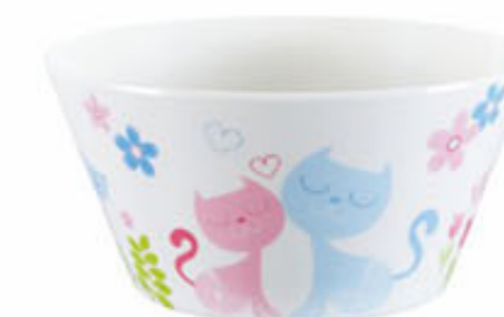
37112 V形碗 138 × 138 × 70mm 6943203404487