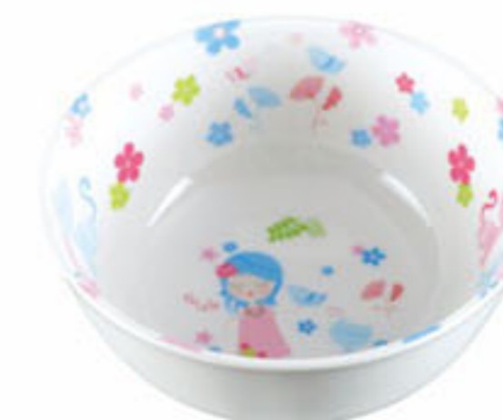
KD504 碗 116 × 116 × 50mm 6943203406429