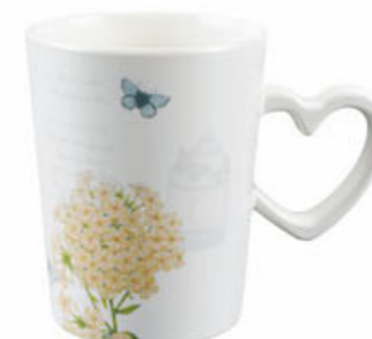
42083 心型杯 125 × 82 × 103mm 6943203404654