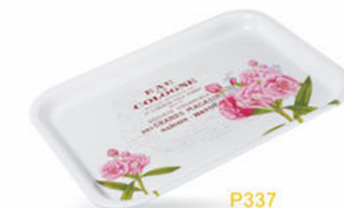
P337 托盘 373 × 279 × 20mm 6943203407426