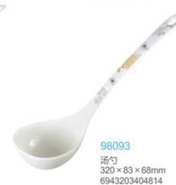
98093 汤勺 320 × 83 × 68mm 6943203404814