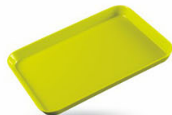
托盘4号 PN335 DIMENSIONS 350L × 249W × 22H mm NUMBER 6943203404333