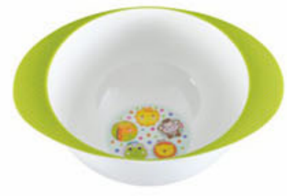
36005 双耳碗 160 × 120 × 60mm 6943203407006