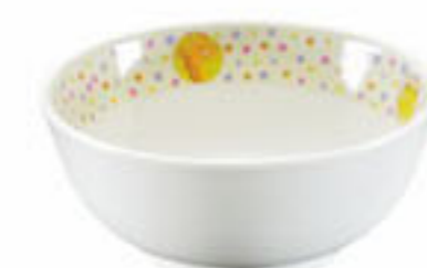
KD504 圆碗 116 × 116 × 50mm 6943203406429