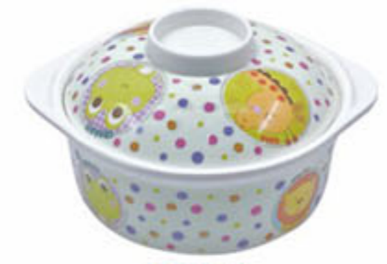
32054+U 带盖小碗 143 × 120 × 85mm 6943203406498