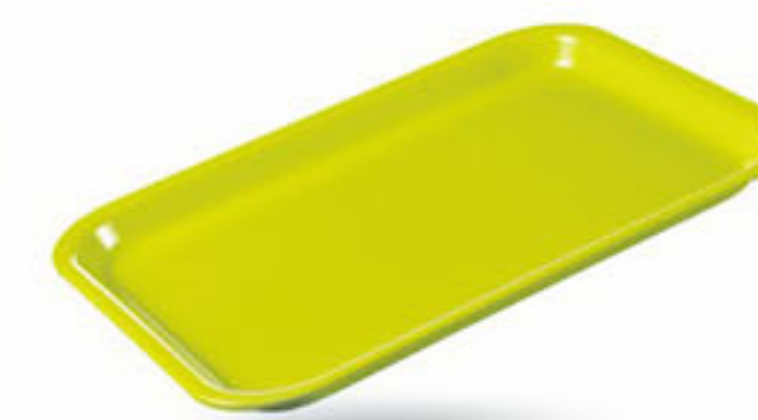
带边托盘4号 P341 DIMENSIONS 406L × 306W × 25H mm NUMBER 6943203407333