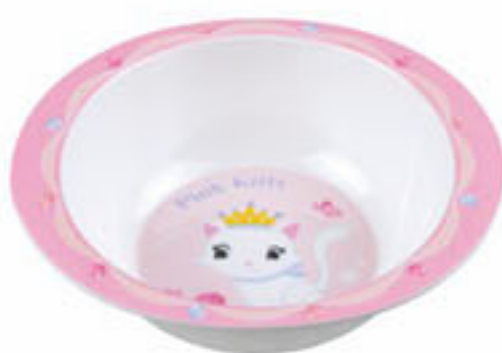
33121 奇哥碗 152 × 138 × 45mm 6943203404753