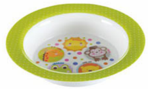
36010 汤碗 166 × 166 × 33mm 6943203405385