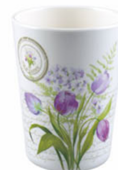
42387 杯子 85 × 85 × 118mm 6943203408263