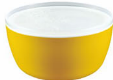
大号密封保鲜盒 39612 DIMENSIONS 203L × 203W × 99H mm NUMBER 6943203404869