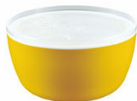
中号密封保鲜盒 39619 DIMENSIONS 165L × 165W × 80H mm NUMBER 6943203405187