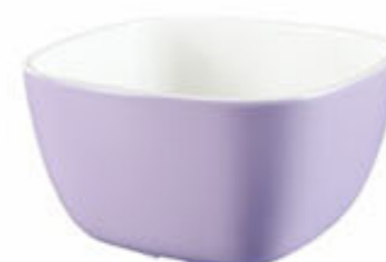
33349 双色四方碗 127 × 127 × 70mm 6943203408041