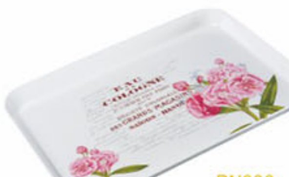
PN338 托盘 380 × 280 × 23mm 6943203404340