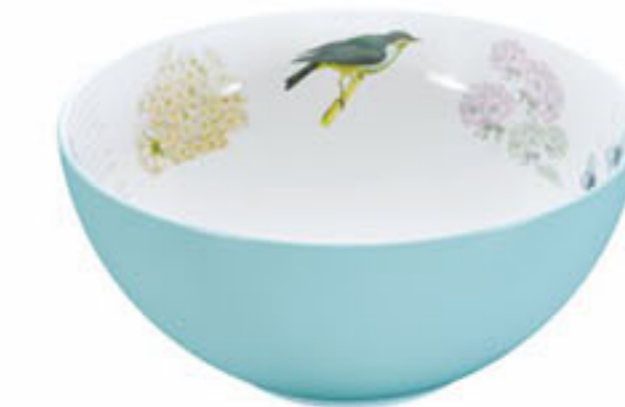
浅蓝 Light Blue