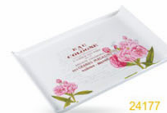
24177 托盘 345 × 225 × 28mm 6943203404388