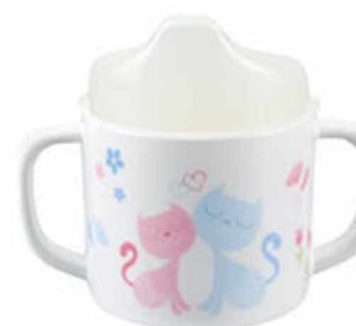
41006 双耳杯 115 × 75 × 66mm 6943203404395