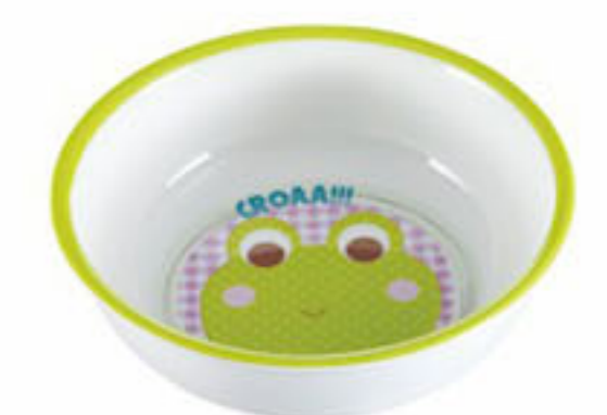
30047 圆碗 138 × 138 × 47mm 6943203404463