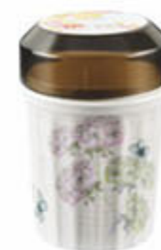
60161 圆形牙签盒 55 × 45 × 83mm 6943203407464