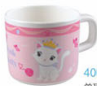
40001 单耳杯 75 × 75 × 67mm 6943203405361