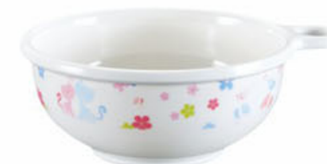
39037 单耳碗 135 × 112 × 45mm 6943203406351