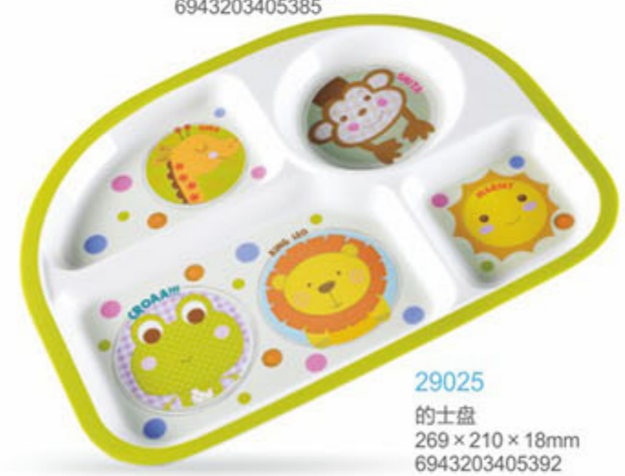
29025 的士盘 269 × 210 × 18mm 6943203405392