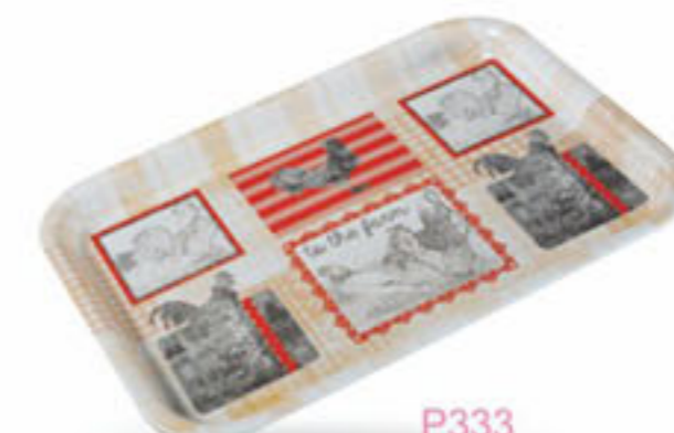
P333 托盘 323 × 230 × 22mm 6943203407419