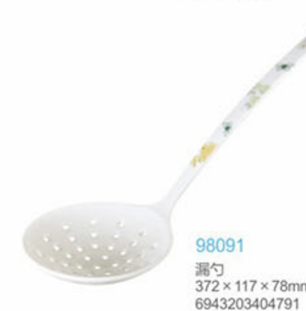
98091 漏勺 372 × 117 × 78mm 6943203404791