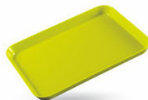
托盘2号 PN327 DIMENSIONS 269L × 184W × 22H mm NUMBER 6943203404326