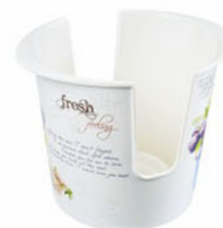
60214 圆形饰品收纳盒 189 × 150 × 149mm 6943203408133