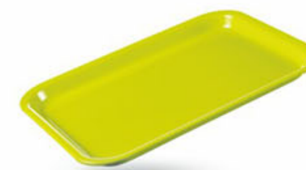
托盘 P337 DIMENSIONS 374L × 280W × 210H mm NUMBER 6943203407426