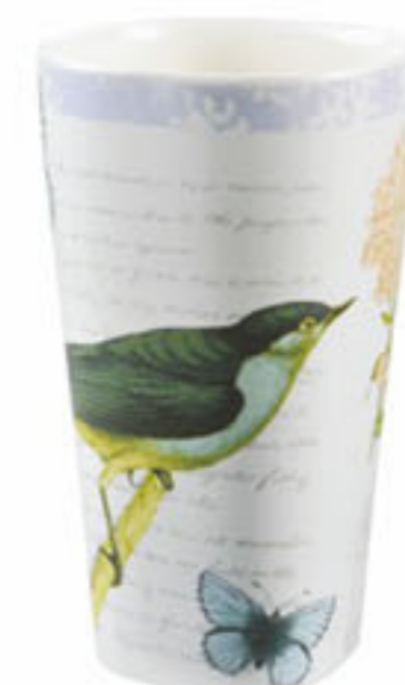
42061 方型无耳杯 73 × 73 × 130mm 6943203405439