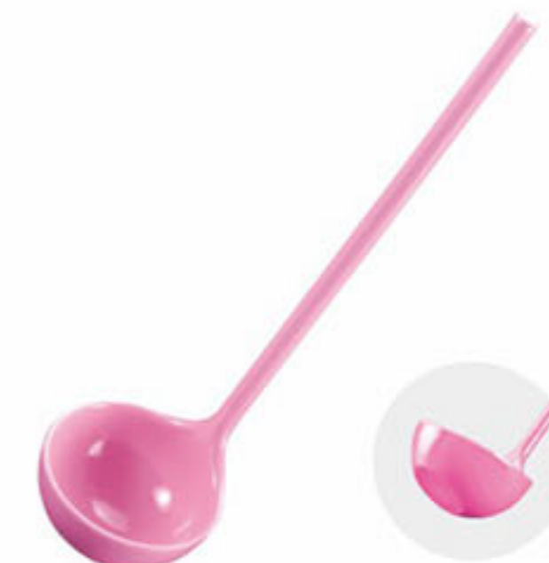
汤匙 98236 DIMENSIONS 300L × 80W × 75H mm NUMBER 6943203408256