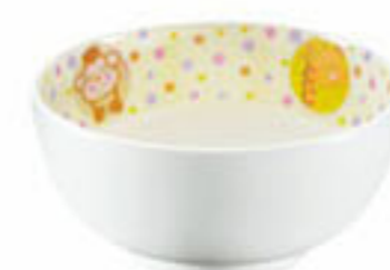
B523 4.4"碗 110 × 110 × 55mm 6943203406412