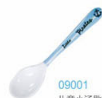
09001 儿童小汤匙 140 × 34 × 20mm 6943203404180