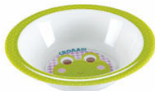
30017 带边碗 160 × 160 × 40mm 6943203407266