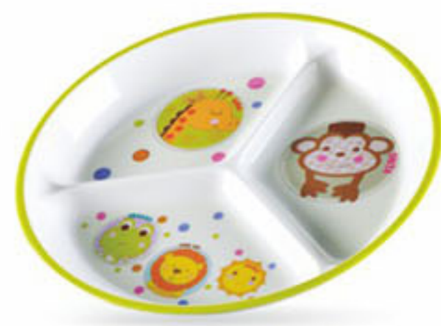
D419 三格盘 188 × 188 × 25mm 6943203406993