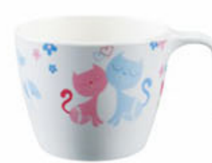
42255 小单耳杯 78 × 58 × 46mm 6943203407334