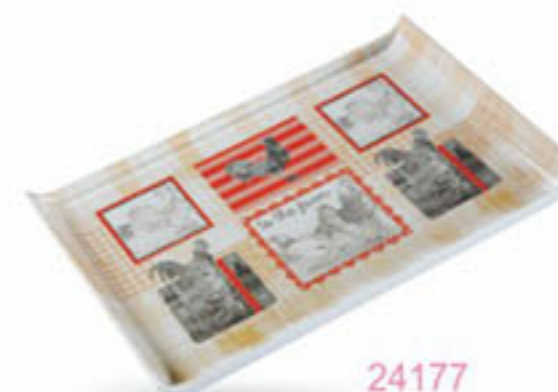
24177 托盘 345 × 225 × 28mm 6943203404388