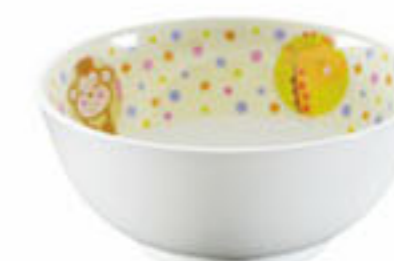
KD505 圆碗 128 × 128 × 57mm 6943203406436