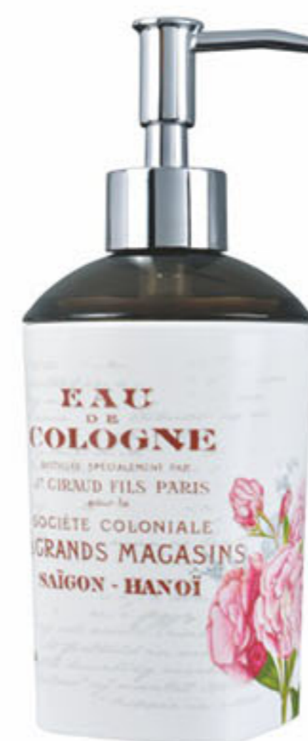
42321 牙刷架/乳液瓶/牙刷杯 × 2 83 × 83 × 110mm 6943203407600