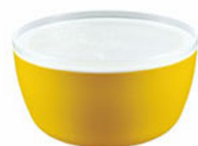
小号密封保鲜盒 36218 DIMENSIONS 126L × 126W × 65H mm NUMBER 6943203404647