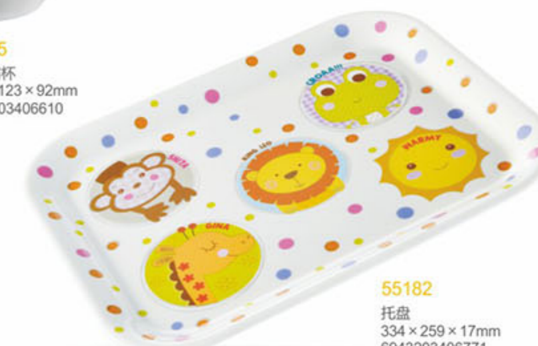
55182 托盘 334 × 259 × 17mm 6943203406771