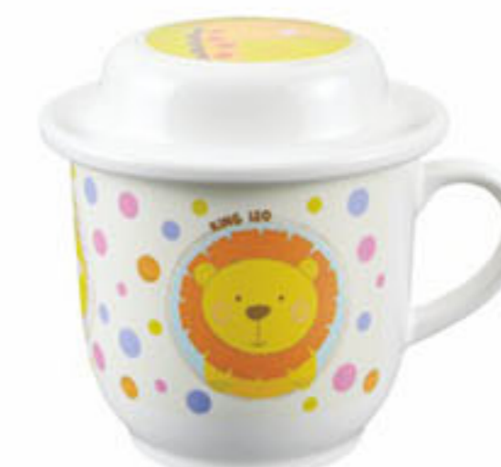
41012+U 带盖水杯 101 × 88 × 83mm 6943203406511