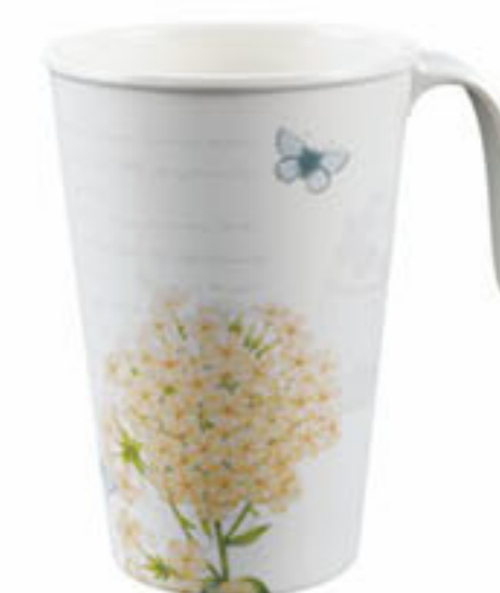
42156 手把杯 104 × 81 × 119mm 6943203406528