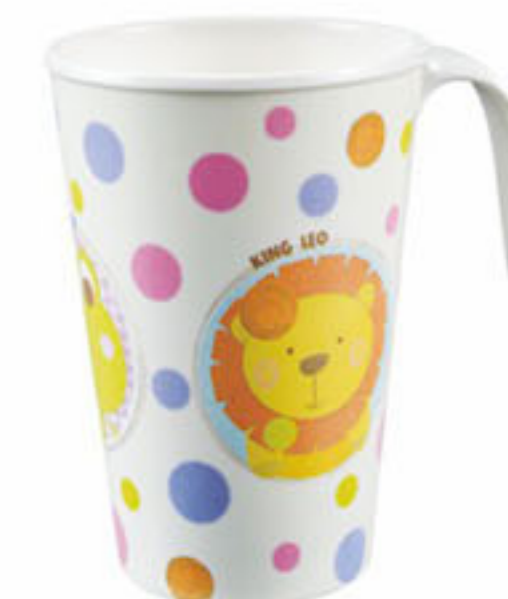
42156 手把杯 104 × 81 × 119mm 6943203406528