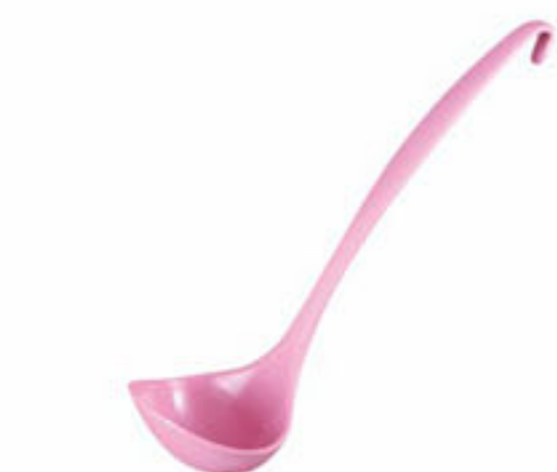
带勾汤勺 98773 DIMENSIONS 320L × 29W × 75H mm NUMBER 6943203404807