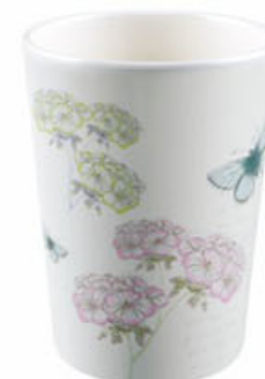
42387 杯子 85 × 85 × 118mm 6943203408263