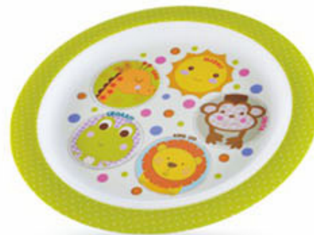
28019 平盘 222 × 222 × 12mm 6943203404715