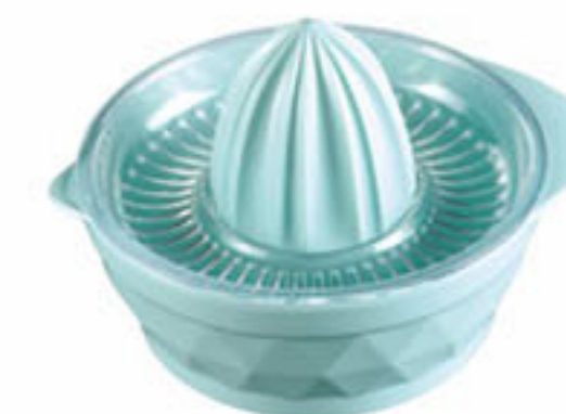
浅蓝 Light Blue