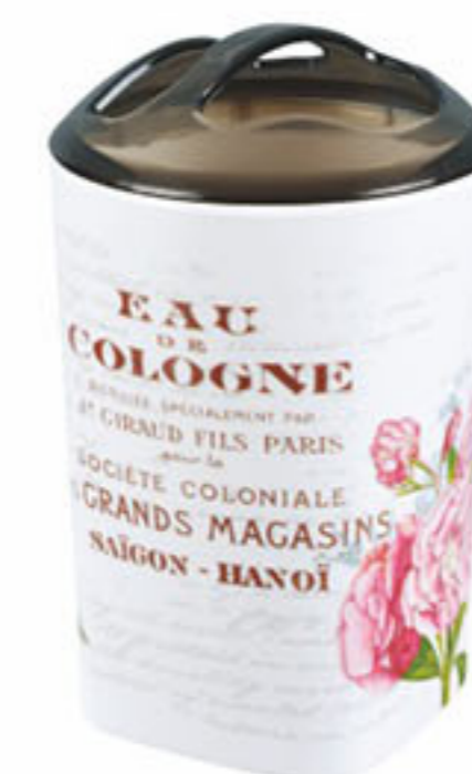
42321 牙刷架/乳液瓶/牙刷杯 × 2 83 × 83 × 110mm 6943203407600