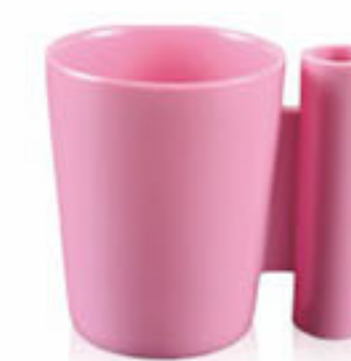
漱口杯 42107 DIMENSIONS 110L × 80W × 98H mm NUMBER 6943203405057