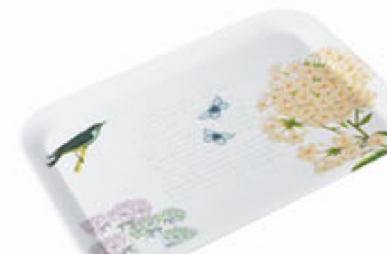
55183 托盘 392 × 292 × 18mm 6943203406764