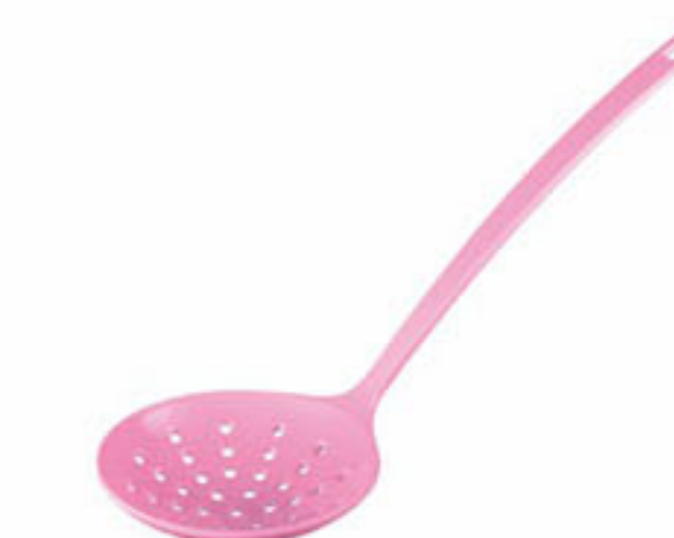
漏勺 98091 DIMENSIONS 372L × 117W × 78H mm NUMBER 6943203404791