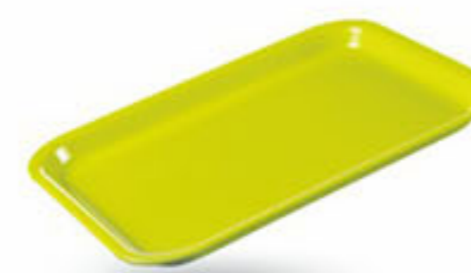
托盘 P333 DIMENSIONS 323L × 230W × 23H mm NUMBER 6943203407419