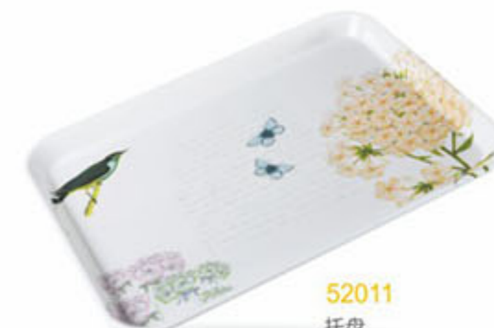
52011 托盘 406 × 306 × 23mm 6943203404906