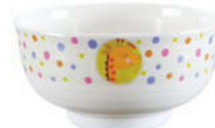
39038 横纹饭碗 120 × 120 × 60mm 6943203406368