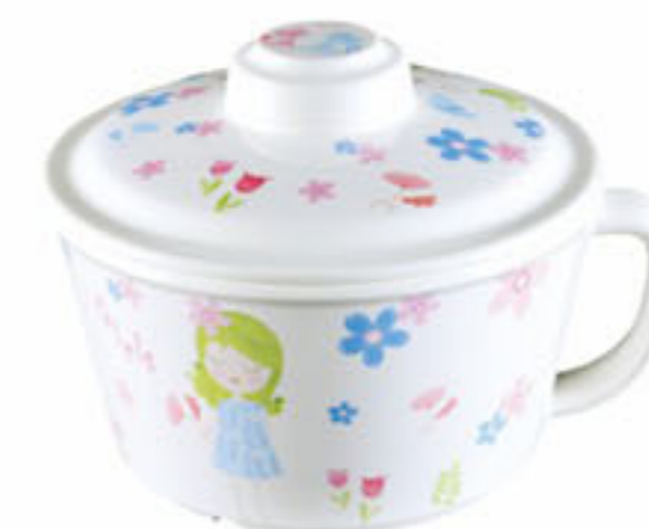
42038+U 单耳杯 160 × 140 × 110mm 6943203406504