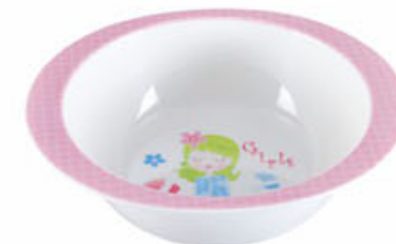
33121 奇哥碗 152 × 138 × 45mm 6943203404753