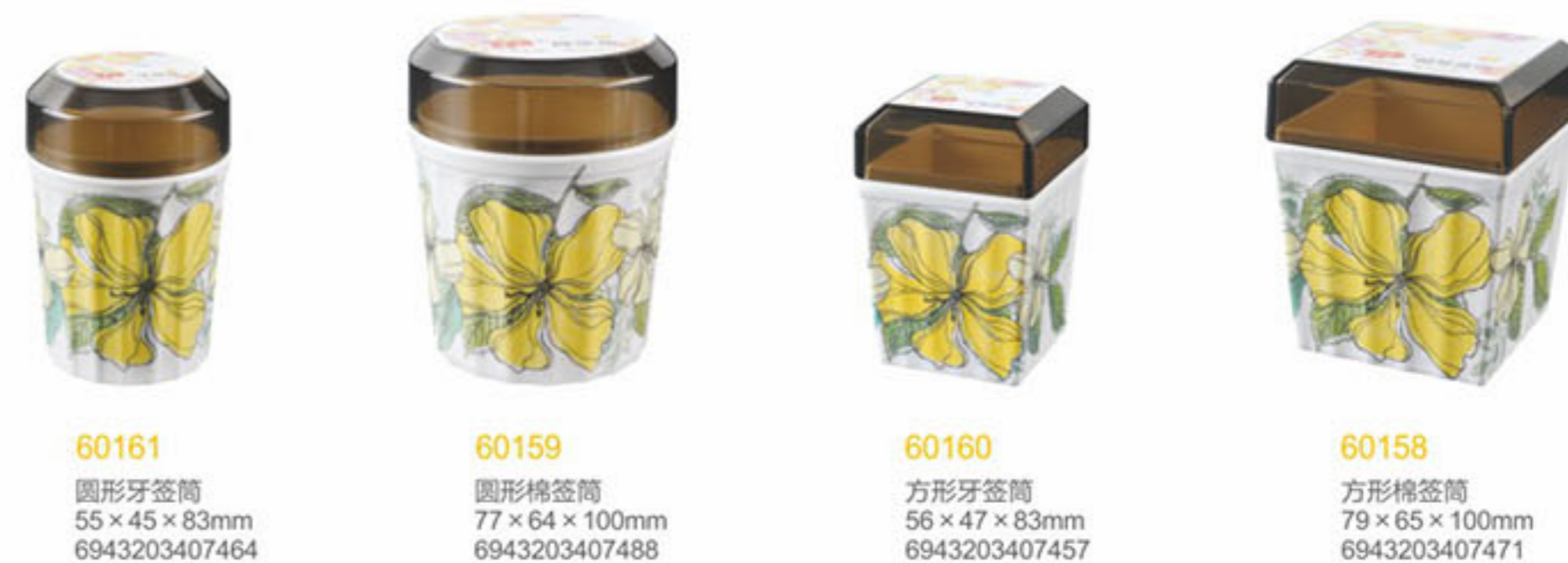
60161 圆形牙签筒 55 × 45 × 83mm 6943203407464