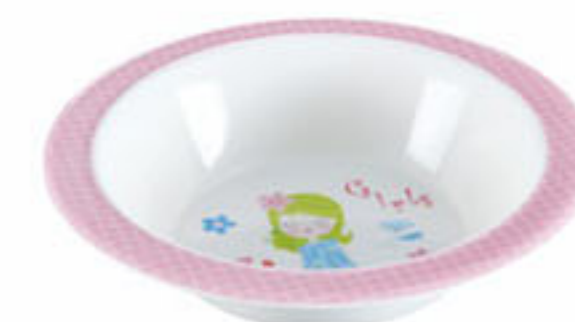
30013 带边碗 165 × 165 × 40mm 6943203407167