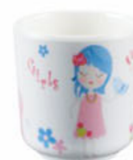
42282 无耳杯 47 × 47 × 50mm 6943203407389