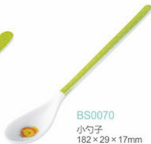
BS0070 小勺子 182 × 29 × 17mm 6943203406894