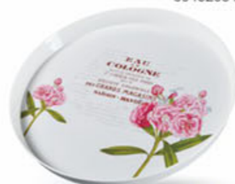
55239 托盘 280 × 280 × 22mm 6943203404265