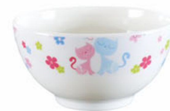
00045 饭碗 113 × 113 × 55mm 6943203405378