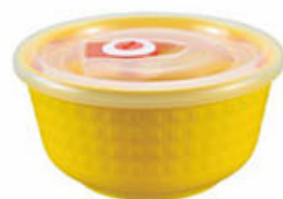
中号密封保鲜盒 39668 DIMENSIONS 135L × 135W × 67H mm NUMBER 6943203405231