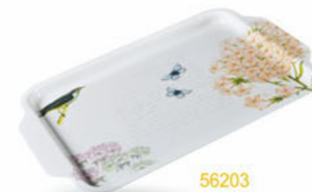
56203 托盘 328 × 232 × 22mm 6943203404883