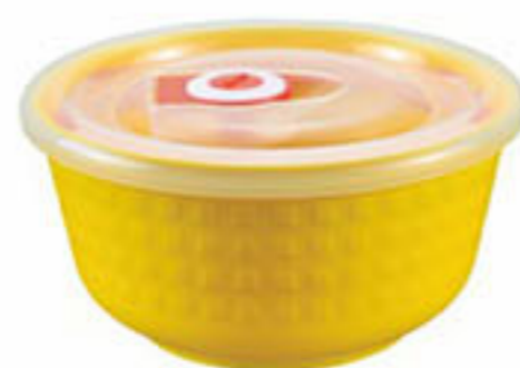
大号密封保鲜盒 39669 DIMENSIONS 161L × 161W × 75H mm NUMBER 6943203405224