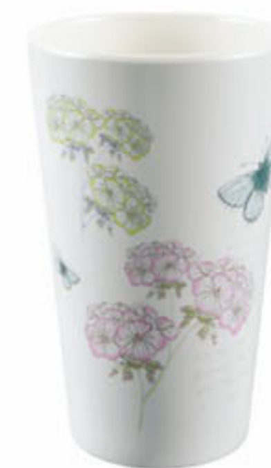
42081 杯子 90 × 90 × 150mm 6943203408218