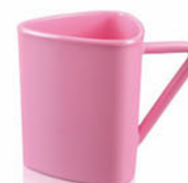
三角杯 42018 DIMENSIONS 125L × 88W × 100H mm NUMBER 6943203405040