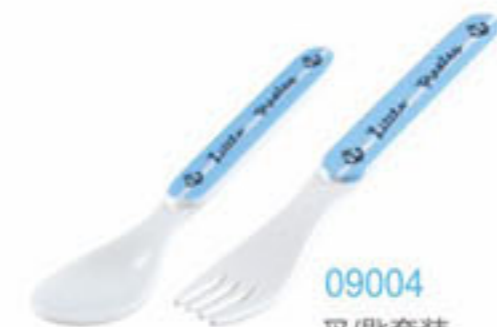
09004 叉/匙套装 140 × 23 × 14mm 140 × 35 × 15mm 6943203406603