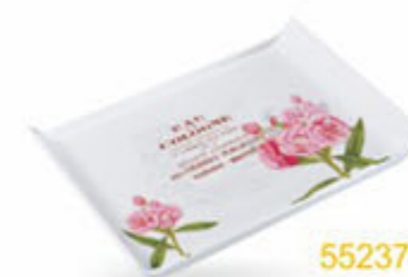
55237 托盘 300 × 160 × 26mm 6943203403473