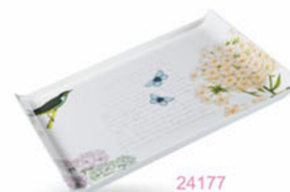
24177 托盘 345 × 225 × 28mm 6943203404388