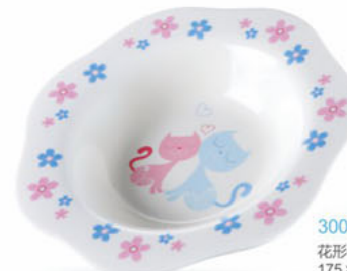
30023 花形碗 175 × 175 × 33mm 6943203407174