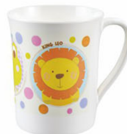
40029 杯子 81 × 81 × 96mm 6943203407020