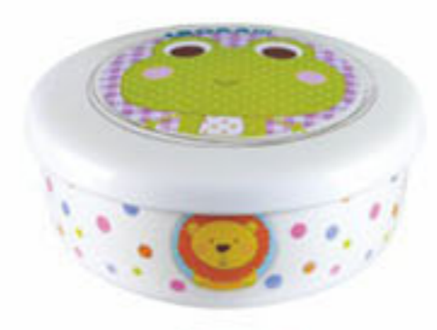
37100+U 带盖小碗 108 × 108 × 50mm 6943203403862