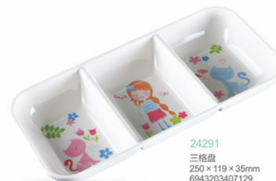
24291 三格盘 250 × 119 × 35mm 6943203407129