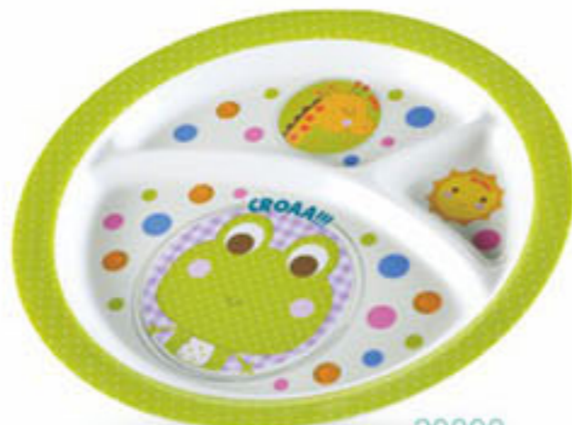
20090 旁分三格盘 214 × 214 × 19mm 6943203406825