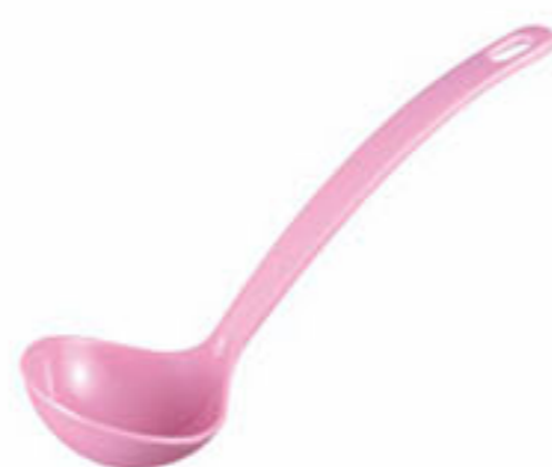
汤勺 09060 DIMENSIONS 228L × 74W × 32H mm NUMBER 6943203404821