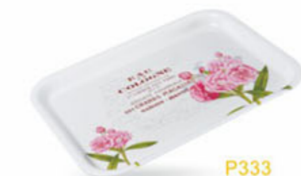
P333 托盘 323 × 230 × 23mm 6943203407419